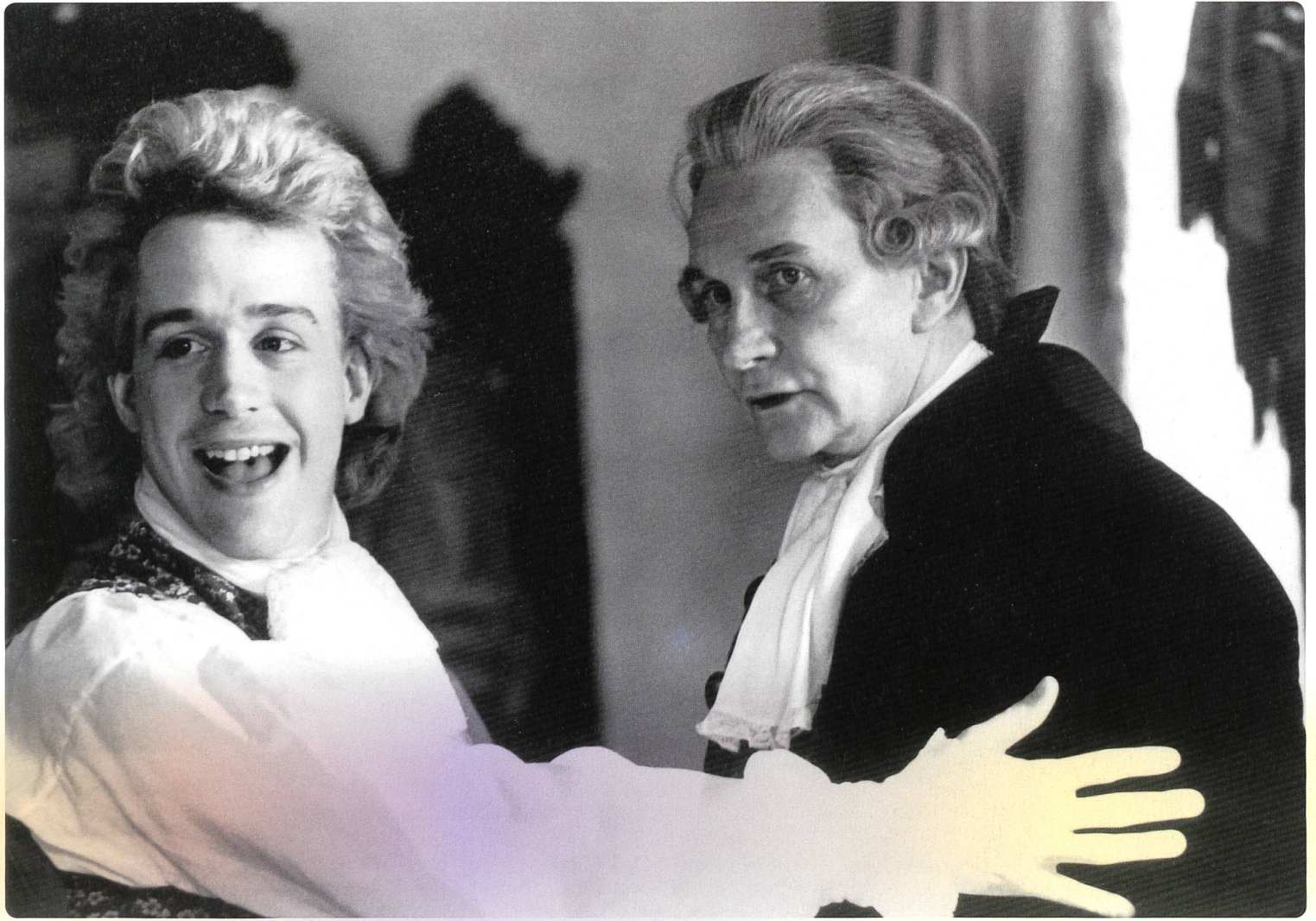
1 EINE KLEINE NACHTMUSIK Regie: Leopold Hainisch (1940); 2 Tome Hulse und Roy Dotrice (Leopold Mozart) in AMADEUS Regie: Milos Forman (1984)

mal da der fikionalisierte Salieri ein Geisteskranker im Irrenhaus ist. Und einem Verrückten muss man nichts und kann man alles glauben. So einfach ist das.