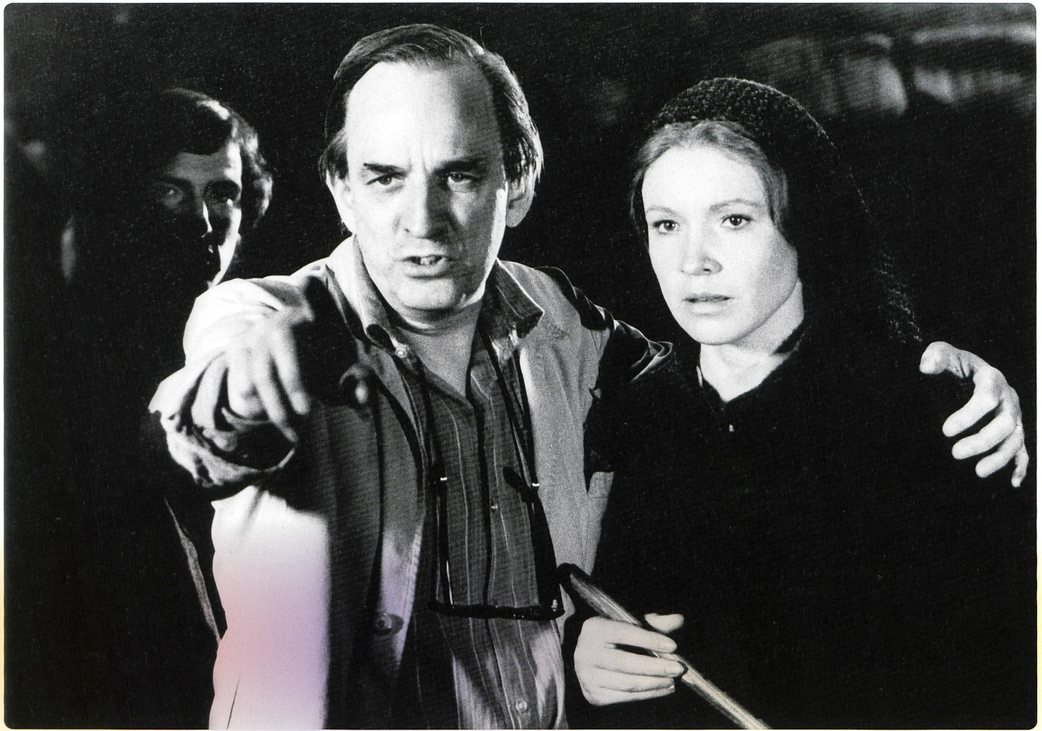
1 Dreharbeiten zu WEN DIE GÖTTER LIEBEN Regie: Karl Hartl (1942)