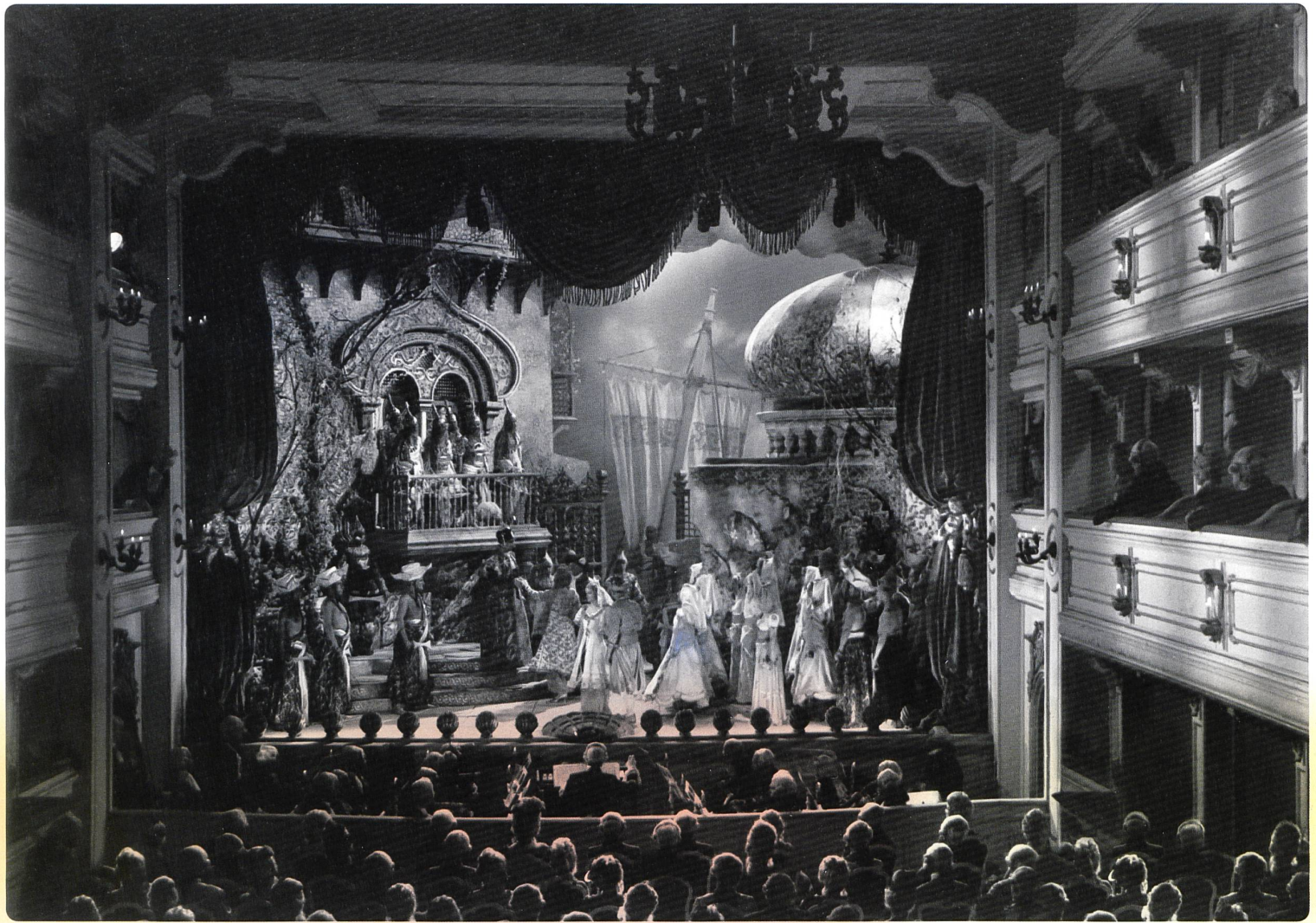
1 MOZART – AUFZEICHNUNGEN EINER JUGEND Regie: Klaus Kirschner (1975) 2 WEN DIE GÖTTER LIEBEN Regie: Karl Hartl (1942)

da sind die Grenzen fließend zwischen Bio-Pic und filmischer Illustration von Mozart-Musik. Überliefert ist auch ein Fragment des 1921 in Österreich entstandenen Films von Otto Kreisler: MOZARTS LEBEN, LIEBEN UND LEIDEN . Womit wir wieder beim Harlekin, also der Posse, und bei der Tragödie wären, aber bis zum Leiden reicht das Fragment nicht. Und das ist auch noch nur in einer holländischen Version erhalten.