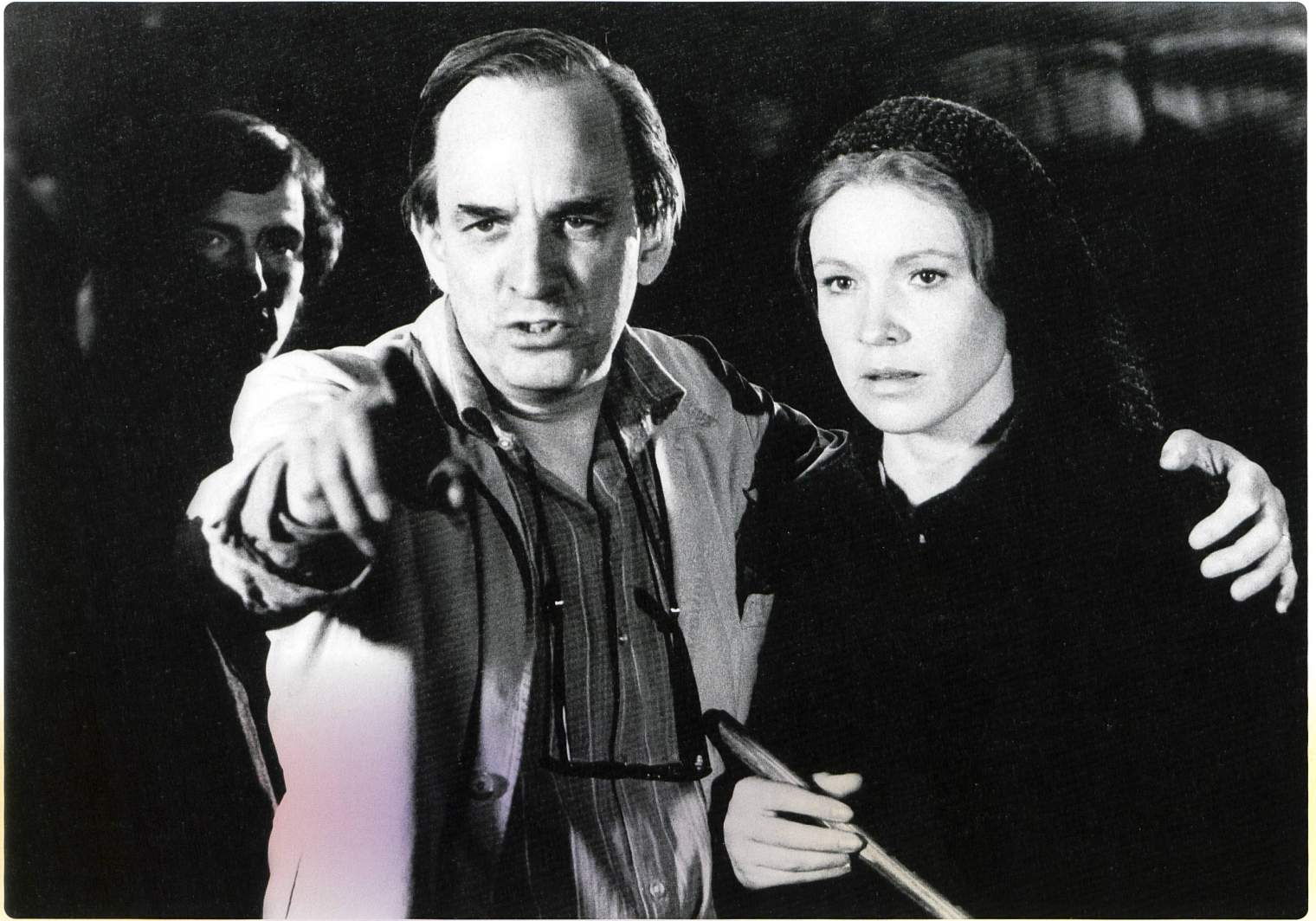
1 Dreharbeiten zu WEN DIE GÖTTER LIEBEN Regie: Karl Hartl (1942)