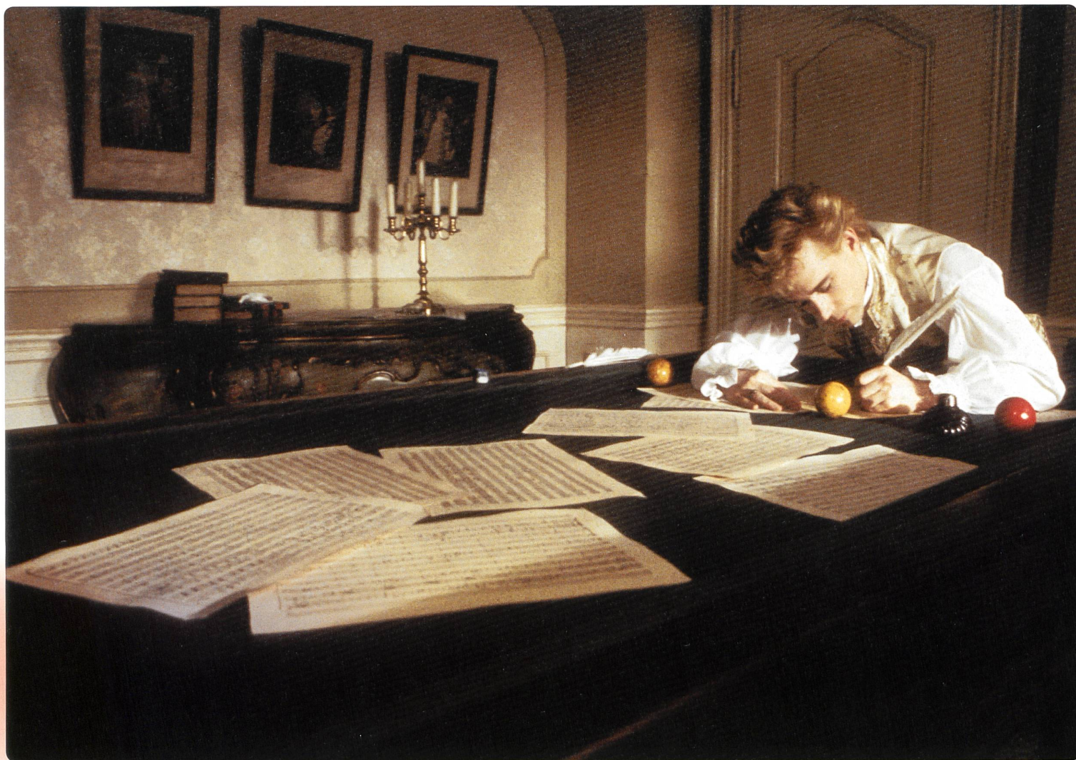
1 F. Murray Abraham (Antonio Salieri) in AMADEUS Regie: Milos Forman (1984); 2 Tom Hulce in AMADEUS

Der Romancier und Essayist Hanns-Josef Ortheil hat über ein ganzes Jahr hin, vom 27. Januar 2005 bis zum 27. Januar 2006, dem Geburtstag Mozarts, täglich Mozart gehört, das komplette Werk. Er hat seine Eindrücke und Reflektionen beim immer tieferen Eindringen in die Musik notiert und diese Notate mit den Erlebnissen und Erfahrungen des Alltags verbunden. Immer wieder kommt Ortheil, der sich nicht als besonderer Filmkenner ausweist – und es auch wohl nicht ist – auf seine Beobachtung zu sprechen, wie reibungslos Szenen des Alltags sich mit der Musik verbinden, so dass beide eine Einheit werden. «Ich höre die fünf Divertimenti KV 439b im Elefantenhaus des Stuttgarter Zoos nicht als Hintergrund-, sondern als Film-Musik. Als Film-Musik begleiten sie nicht nur das Geschehen, sondern treten in enge Verbindungen zu den Bildern; in diesem Fall könnte man sogar davon sprechen, dass die Bilder genau diese Musik evoziert haben.» Bei keinem anderen Komponisten als Mozart geschieht, dass man in den Filmen mit seiner Musik vergessen kann, was zuerst da war, das Bild oder die Musik.