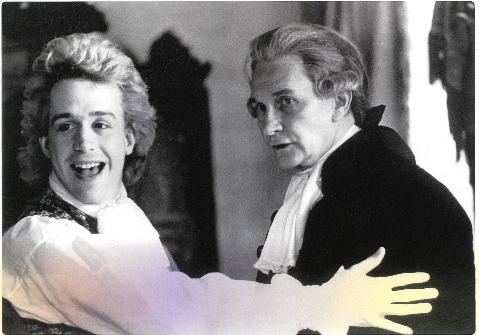
1 EINE KLEINE NACHTMUSIK Regie: Leopold Hainisch (1940); 2 Tome Hulce und Roy Dotrice (Leopold Mozart) in AMADEUS Regie: Milos Forman (1984)

mal da der fikionalisierte Salieri ein Geisteskranker im Irrenhaus ist. Und einem Verrückten muss man nichts und kann man alles glauben. So einfach ist das.