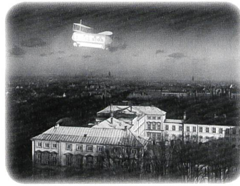
HIMMELSKIBET Regie: Holger-Madsen (1918)