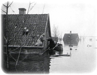
VERDENS UNDERGANG Regie: August Blom (1916)