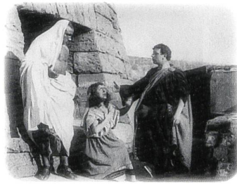
CABIRIA Regie: Giovanni Pastrone (1914)