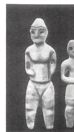
sumerische Statuetten aus dem Irak Museum in Bagdad, drittes Jahrtausend vor Christus