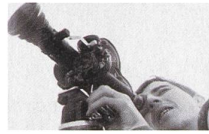
Titelblatt: Rebecca Romijn-Stamos und Antonio Banderas in FEMME FATALE von Brian De Palma