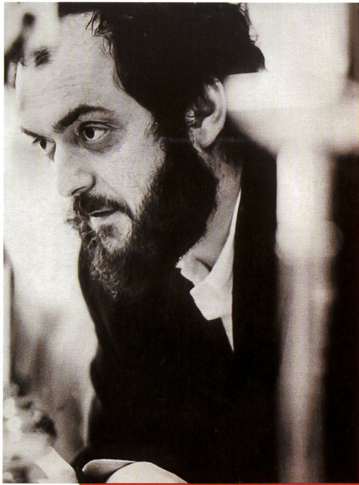
Stanley Kubrick 1928-1999