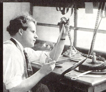
Sergej M. Eisenstein