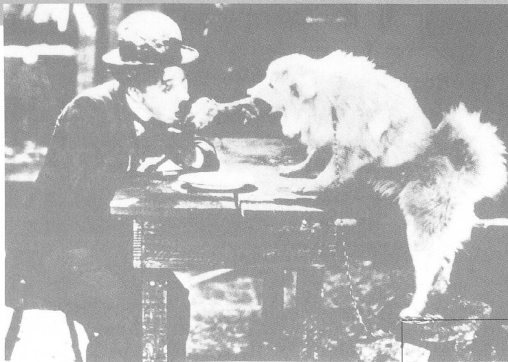
THE GOLDRUSH von Charles Chaplin