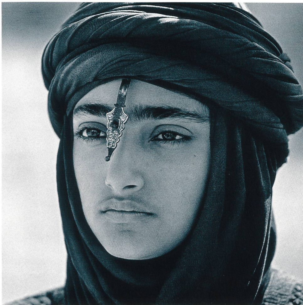
Produktion: CARTHAGO FILMS, Paris; Verleih Schweiz: trigon-film, Basel.