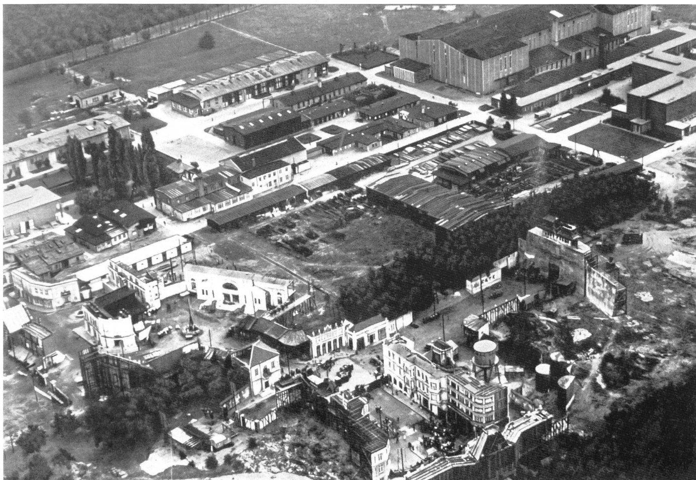
Ufa-Gelände Neubabelsberg, mit mehr als 430 000 qm Gesamtfläche und 11 grossen Atelierhallen

Dies hat unterschwellig vor allem eine Stilrichtung des deutschen Films offenbart: der ex-