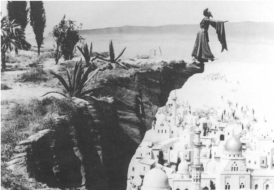
DIE GESCHICHTE VOM KLEINEN MUCK (1953) Regie: Wolfgang Staudte