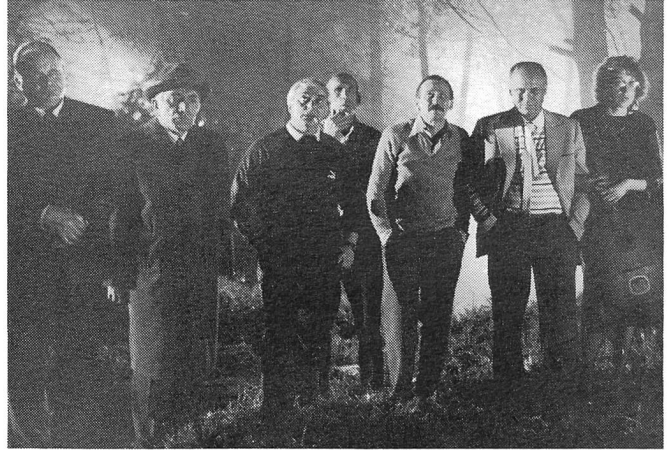
... und Justiz Tiefsinniges von sich geben möchte

reichen. Charlie Chaplin ist das beste Beispiel, das dafür im Kino existiert. Andere Beispiele wären sicher Fellinis LA STRADA , die Filme von Eisenstein oder ONE FLEW OVER THE CUCKOO'S NEST : Filme, die nicht nur vom künstlerischen Standpunkt aus erfolgreich waren, sondern auch beim Publikum ankamen. Mir scheint, das ist der beste Weg, Filme zu machen. Wichtig ist auch hier, ehrlich zu bleiben.