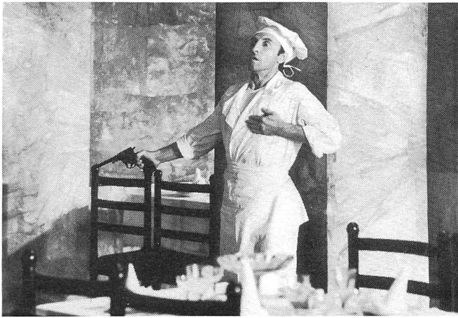
Der Schein kann trügen, ...

dann auf ihr erstes Spielfilmprojekt vor. Es ist ja das erste Mal, dass junge Filmschaffende auf demokratischer Basis ihre ersten Filme realisieren können, ohne dass sie jahrelang warten müssen.