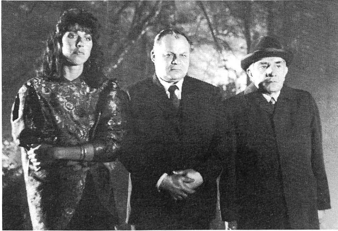
Im Wald, wo die lokale Politik ...