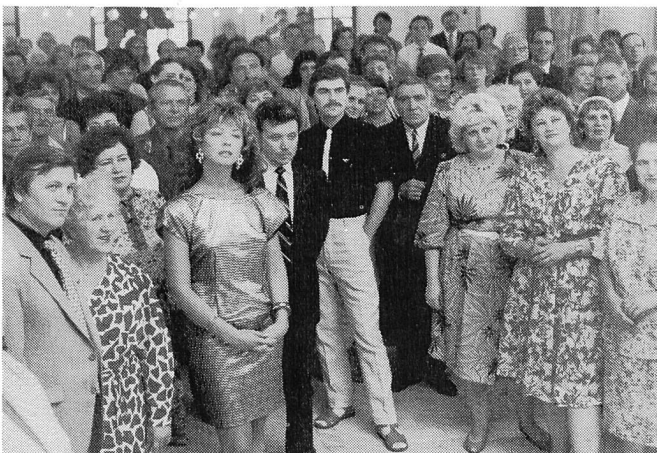
Zu Ehren des ersten Rock'n'Roll-Tänzers des Ortes ...