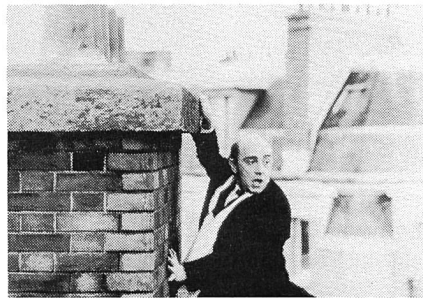
... das man nicht verstehen oder lieben kann,