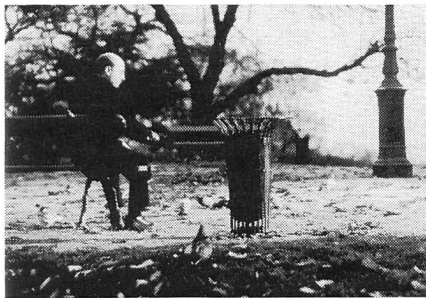
Monsieur Hire, ein Geschöpf, ...