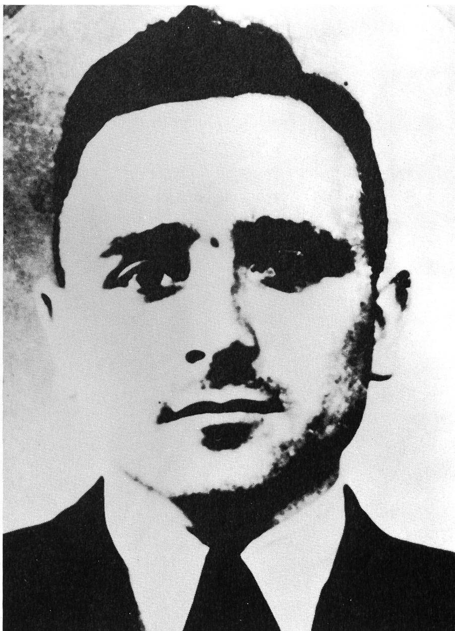
Klaus Barbie, der «Henker von Lyon»