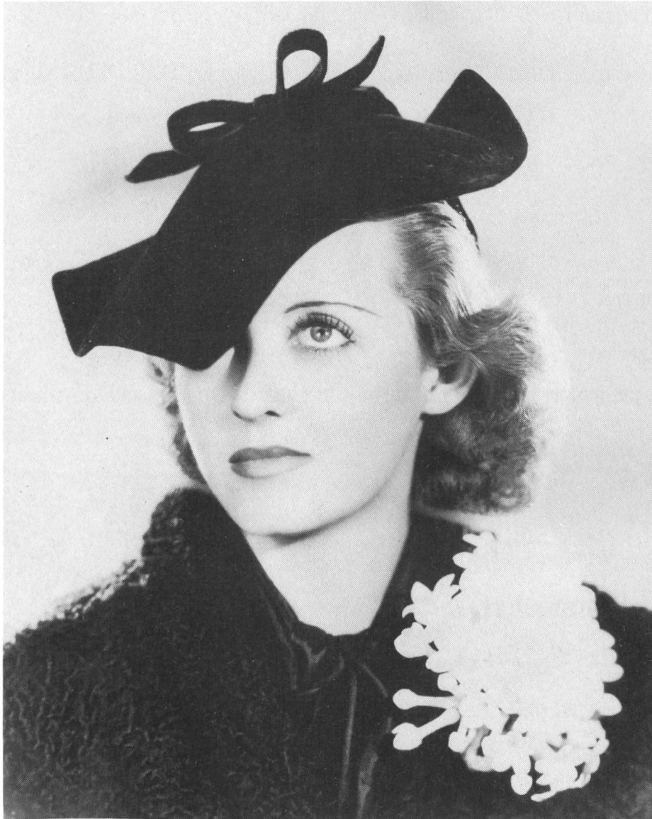
Bette Davis, geb. 5. April 1908