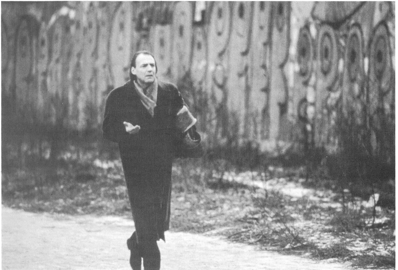
Der Engel nach seiner Menschwerdung

Deutung der Welt, die sich an ebendiese Welt in Form einer allegorisch verschlüsselten Botschaft richtet, deren Sinn sich im Detail erst nach wiederholter 'Lektüre' offenbaren kann.