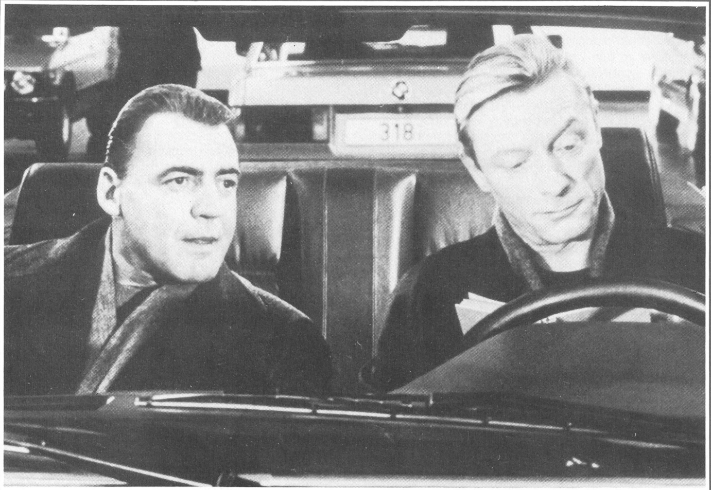
Bruno Ganz und Otto Sander, die beiden Engel Daniel und Cassiel

Wenn ich mich völlig von Deutschland entfremdet habe, werde ich dorthin zurückkehren, um einen Film zu machen. Den Film eines Besuchers aus dem Ausland.