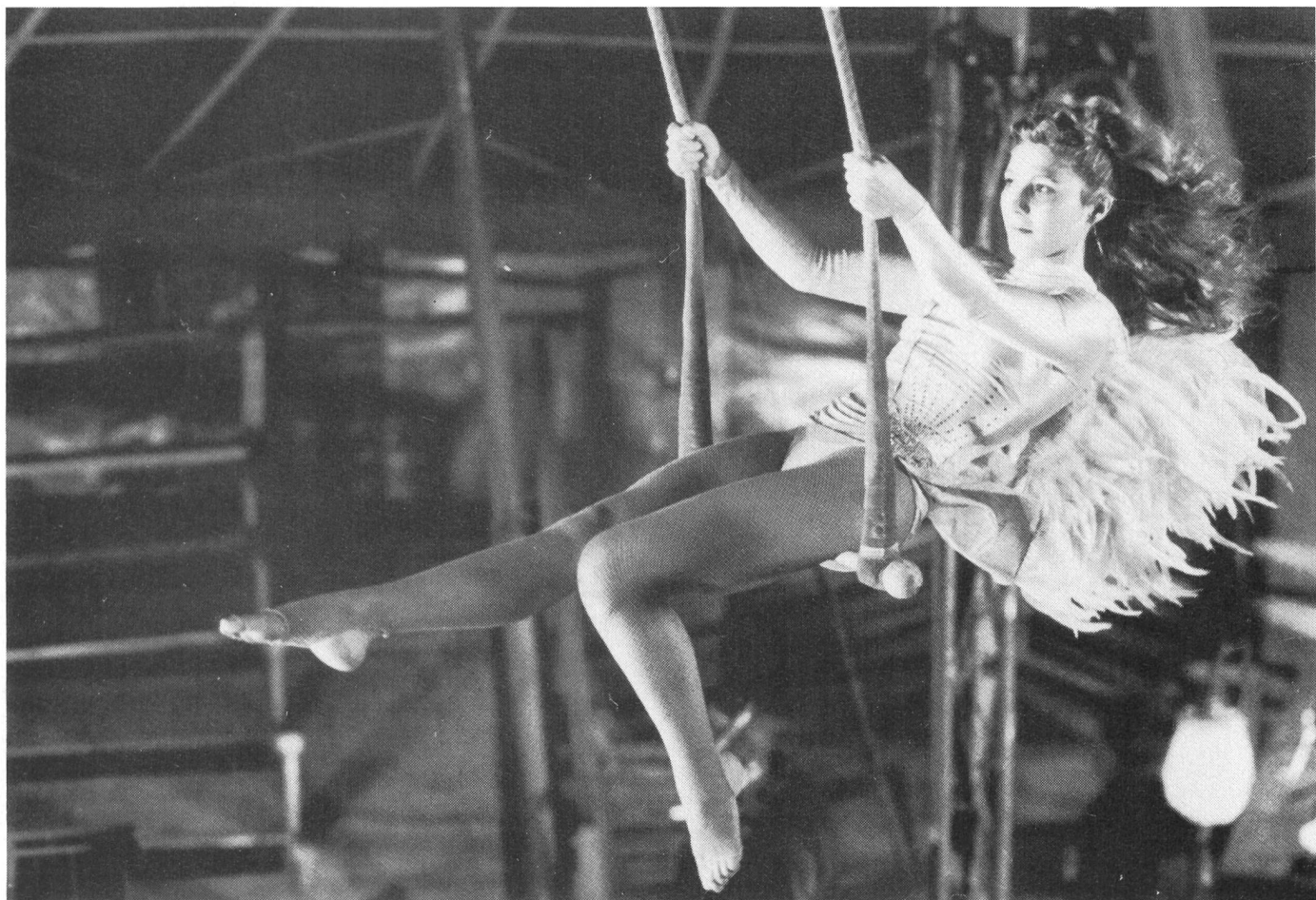
... die ihm wie ein Engel erscheint.

Sinnlichkeit der Darstellungsweise, entfaltet das Dargestellte selbst keine Sinnlichkeit. Die Utopie bleibt im Abstrakten, ist völlig dem Realen entzogen; sie kann funktionieren, weil sie absolut gesetzt ist und in der abschliessenden Stilisierung wie ein schöner, romantischer Traum erscheint; und nur in dieser Form vermag sie offenbar zu existieren. Gegen den deprimierenden Blick hinter die Fassaden hat es das verklärte Gegenbild am Ende ohnehin schwer, sich zu behaupten.