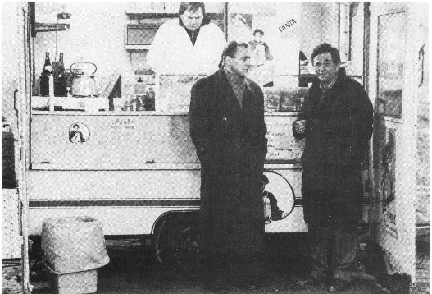
Bruno Ganz und Peter Falk

das Paradies der wahren Empfindung verbaut; über Zeit, Raum, Licht, Farbe, Bewegung und Perspektive als Konstituenten filmischer Beschreibungen von Realität; und über die Macht der Poesie. Eingebettet wird das alles in ein ungewöhnliches Porträt der Stadt Berlin, in dem zeit- und menscheitsgeschichtliche Anmerkungen einen Bogen spannen von der Urzeit bis zum möglichen Ende. Die Komposition in Schwarzweiss und Farbe schwillt mit der Aufnahme und Verarbeitung all dieser Themen an zu der Symphonie einer Grossstadt, in der eine Stadtgeschichte wie die Weltgeschichte erscheint und zum allegorischen Modell wird.