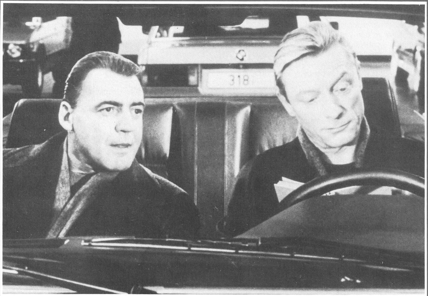
Bruno Ganz und Otto Sander, die beiden Engel Daniel und Cassiel

Wenn ich mich völlig von Deutschland entfremdet habe, werde ich dorthin zurückkehren, um einen Film zu machen. Den Film eines Besuchers aus dem Ausland.