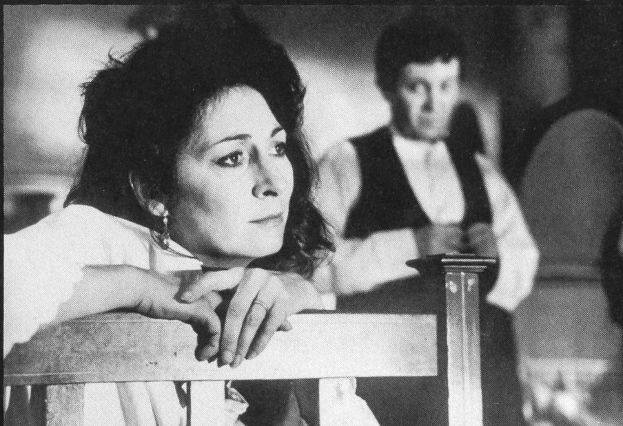
Anjelica Huston in THE DEAD

THE MALTESE FALCON (1941) THE DEAD (1987)