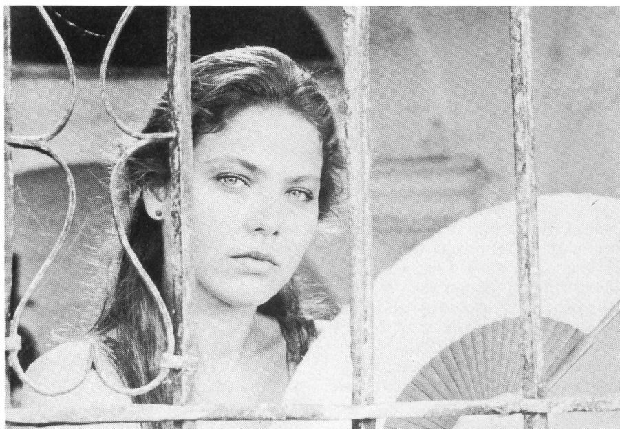
Angela Vicario wird von Bayardo San Roman gefreit und...