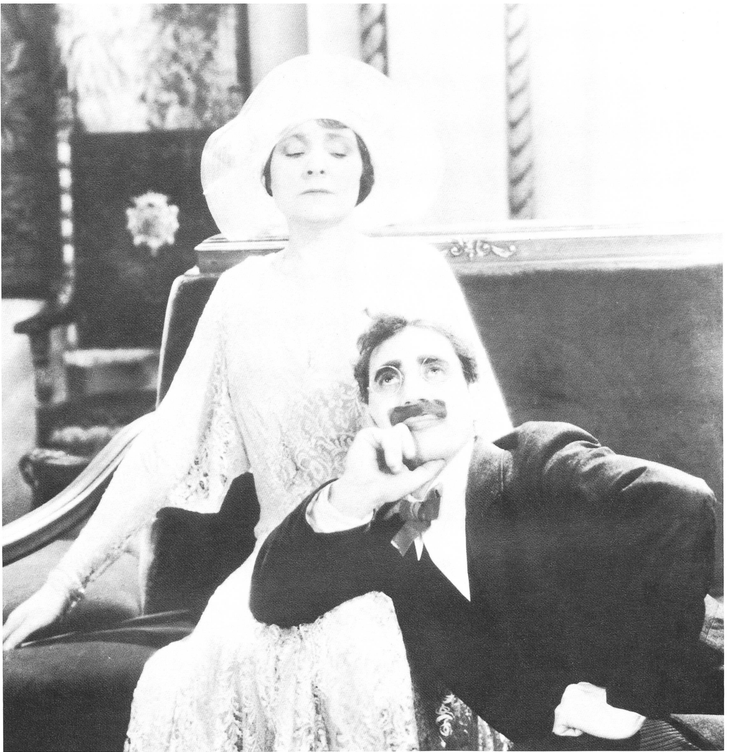
Groucho, mit seinem angemalten Schnauz, macht's mit Sätzen, mit der Stimme, mit Wörtern. Er tut sich keinen Zwang an, auch in der Society nicht.

Ein Blick in zwei alte Zeitschriften? Eine Nummer des «Time»-Magazin, 31. Dezember 1951. Auf der Titelseite, rotgerandet, Groucho Marx in einer Porträtzeichnung. Launig-forscher Blick, sich lichtendes Haar und Nickelbrille, die Cigarre aus dem Mund ragend. Die Bildlegende: «Markenzeichen: Unverschämtheit». Er soll's – gerahmt – zu Hause aufgehängt haben. Die Huldigung im Innern des Heftes – eine Seite, «Personality» betitelt – ist ungezeichnet, handelt mehr von Grouchos TV-Quiz als von den Jahren, als die Filme reden lernten, und beginnt mit dem Satz: «Für einige Amerikaner konkretisiert sich der Name Marx in einem bärtigen Propheten der sozialen Verelendung, aber für die meisten bedeutet er ein clowneskes Durcheinander von Brüdern.»