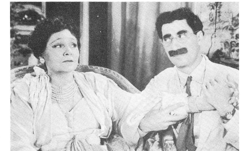
AT THE CIRCUS (1939)