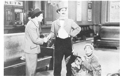
GO WEST (1940)