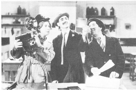
THE BIG STORE