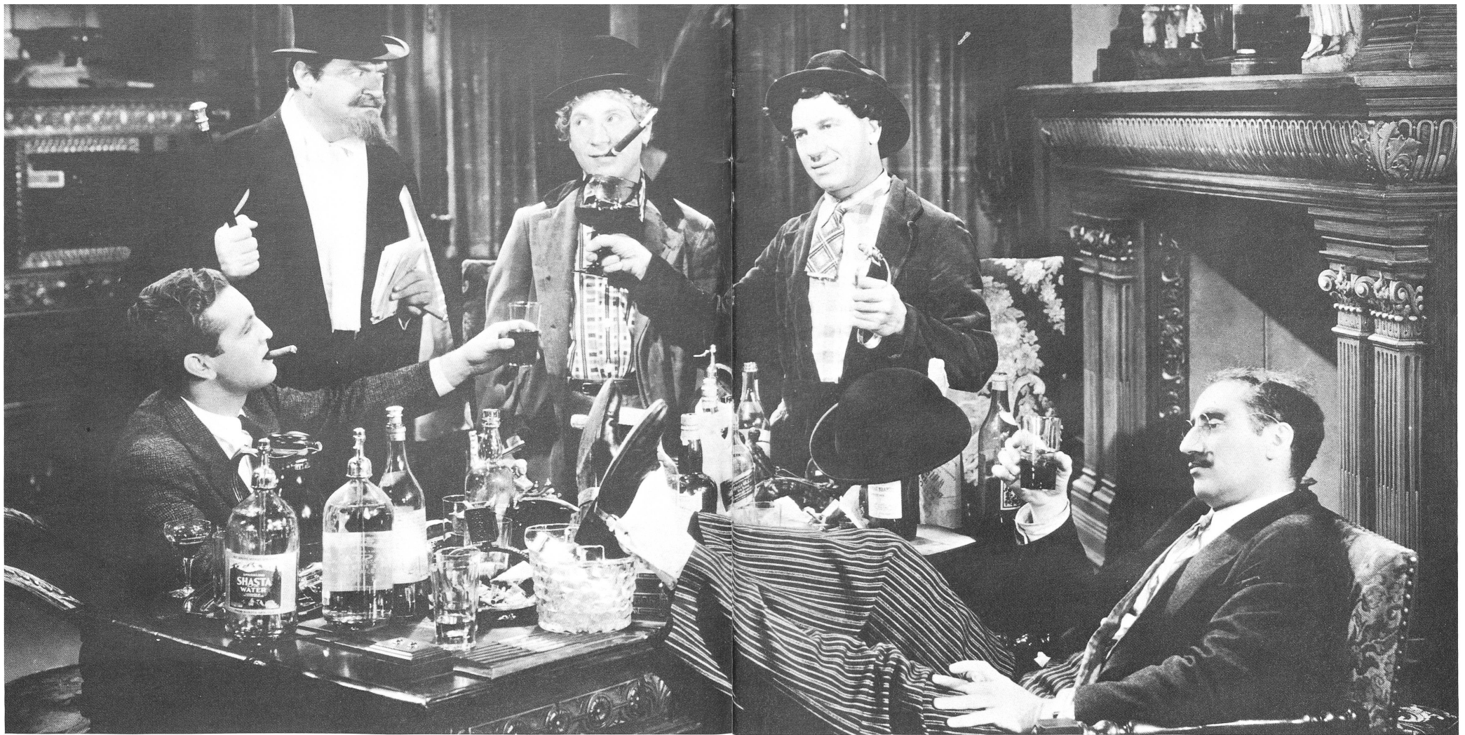
A NIGHT AT THE OPERA

«Whatever it is, I am against it», singt Groucho an anderer Stelle, und es hört sich an wie ein Bekenntnis seiner Lebensphilosophie.