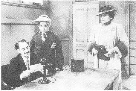
THE BIG STORE (1941)