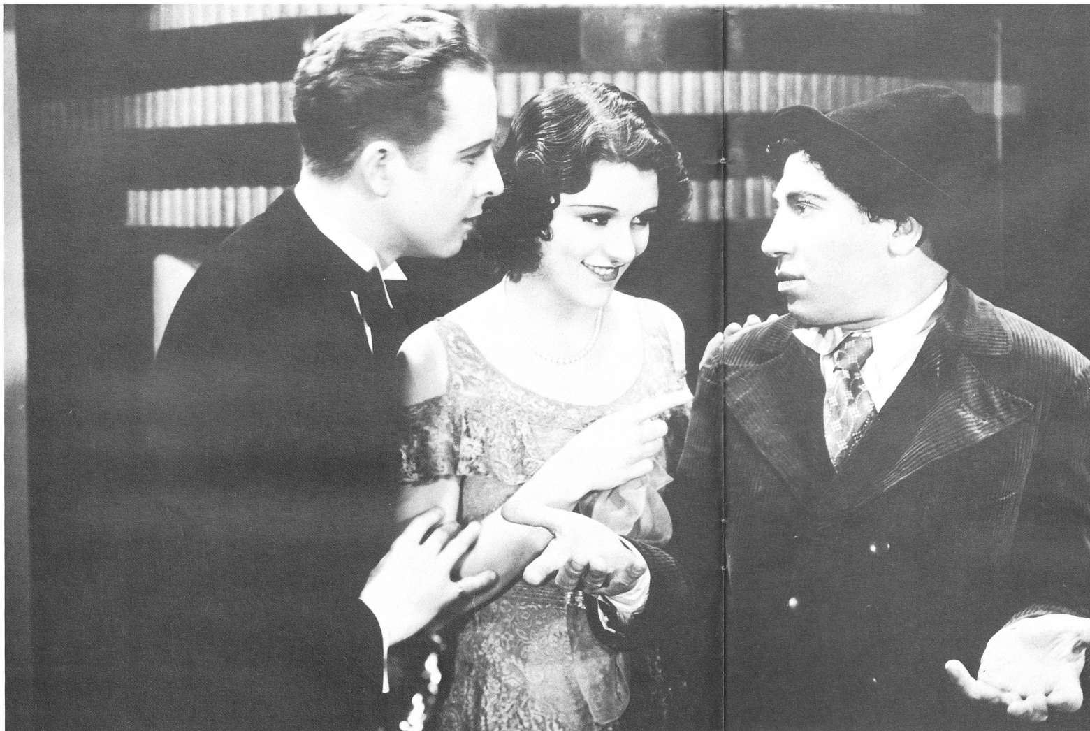
«Chico mag aussehen wie ein Idiot, er mag reden wie ein Idiot, aber lassen Sie sich dadurch nicht täuschen – er ist wirklich ein Idiot.»