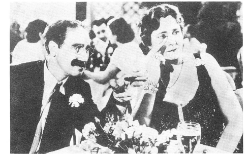
A NIGHT AT THE OPERA