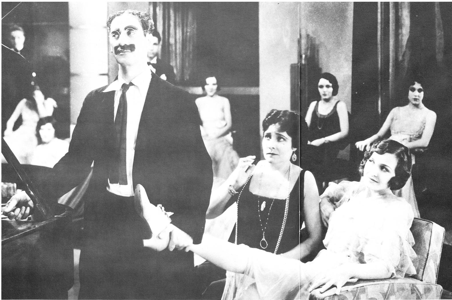
Margaret Dumont – wer sonst? – verkörperte jeweils eine stattliche Lady zwischen Millionärswitwe, Muttergestalt und Blitzableiter für unzählige Jokes.