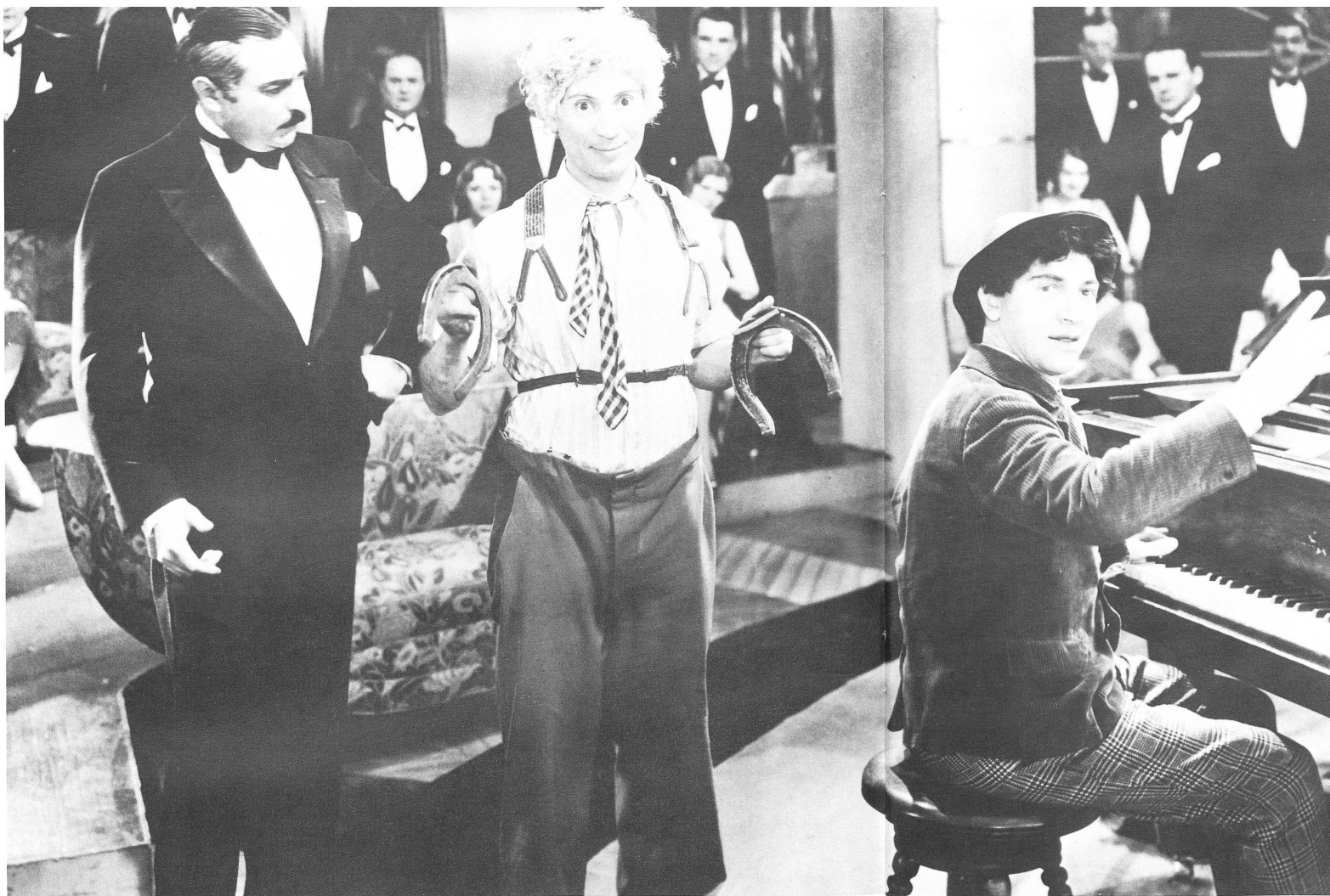
Nein sie scheren sich nicht um Gesetze und Regeln, von Fairness gar nicht zu reden.

lächerlichen Trick durch die Kontrolle zu schlüpfen. Sie zeigen einen Pass von Maurice Chevalier vor, alle denselben, und stimmen einen seiner Schlager an. Harpo, der Stumme, lässt seine Stimme vom Grammophon ertönen. Als das fehlschlägt, gehen sie zum Angriff über. Harpo kommt auf den Tischen der Beamten daher, greift nach den Papieren, den Stempeln, den Dokumenten und wirbelt alles durcheinander. Einer der Immigration Officer bekommt sogar einen Stempelaufruck auf die Glatze. Nicht umsonst hat Antonin Artaud den Film «eine Hymne auf die Anarchie und die integrale Revolte» genannt.