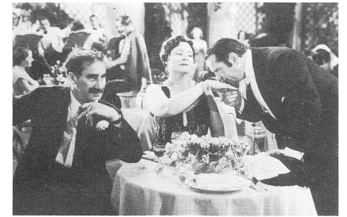
A NIGHT AT THE OPERA (1935)

Die Marx Brothers in Hollywood? Mit THE COCOANUTS, ANIMAL CRACKERS und MONKEY BUSINESS sind drei der fünf Paramount-Filme gedreht. Was noch folgt, sind jene beiden, die Groucho später den College- und den