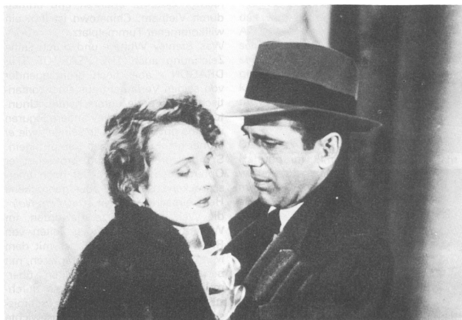
Humphrey Bogart und Mary Astor in THE MALTESE FALCON