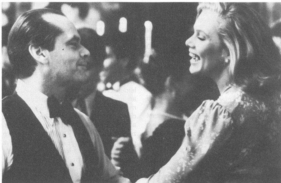
Jack Nicholson und Kathleen Turner in PRIZZI'S HONOR

Schliesslich entscheidet sich Patanna doch für die Ehre - und gegen die Liebe. Das hat er mit Spade gemeinsam. Spade zur O'Shaughnessy: «All we've got is that maybe you love me and maybe I love you. I'll have some rotten nights after I've sent you over, but that'll pass.» In PRIZZI'S HONOR braucht dies nicht ausgesprochen zu werden, es versteht sich auch so. Aber Charley Patanna ist der tragischere Held. Immerhin sprachen für Humphrey Bogart als Spade - «don't be too sure I'm as crooked as I'm supposed to be, that sort of reputation might be good business» - auch noch moralische Beweggründe, handelte er doch für die Ehre der Wohlstandigkeit. Patanna bleibt nur Prizzi's Honor - und allenfalls the stuff that dreams are made of. Wie oft bei Huston