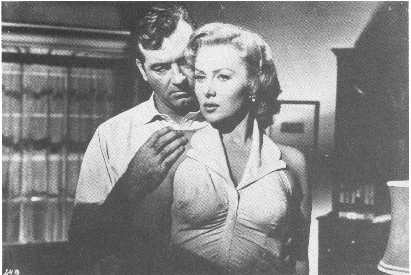
SLIGHTLY SCARLET (1956) John Payne, Rhonda Fleming - Gelassenheit und Selbstgewissheit

Allan Dwan, 1910 bis 1960: fünfzig Jahre Arbeit in Hollywood, fast ausnahmslos als Regisseur, Jahrzehnte hindurch einfach Film an Film gemacht, die beiden letzten Jahre immer wieder Projekte, die nicht zu realisieren waren. Ein grosses Leben - doch, zu unserem Glück, kein Lebenswerk, das ein Ganzes gibt am Ende, das auf einen Begriff zu bringen wäre. In Dwans Filmen spricht das Kino allein für sich selbst, aber sprechen ist nicht richtig, denn wenn das Kino bloss eine Sprache hätte, gäbe es nichts, was uns durch und durch bewegen würde, wenn wir einen Film erleben. Und alles wäre zu einfach.