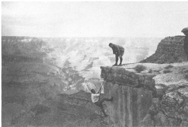
Studiokulisse für Fairbanks (am Seil)