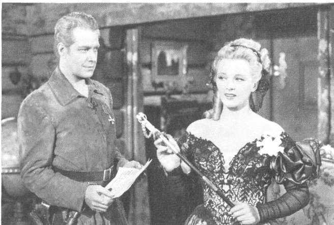
END OF THE RAINBOW