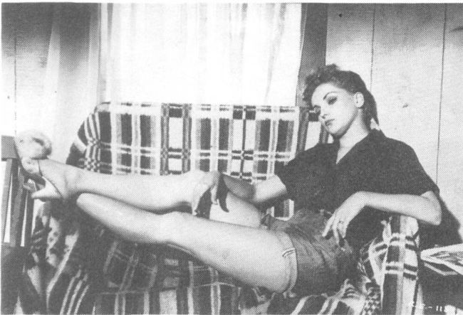
THE RIVERS EDGE

V Die Geschichten bleiben ohne Abschluss, ohne Moral