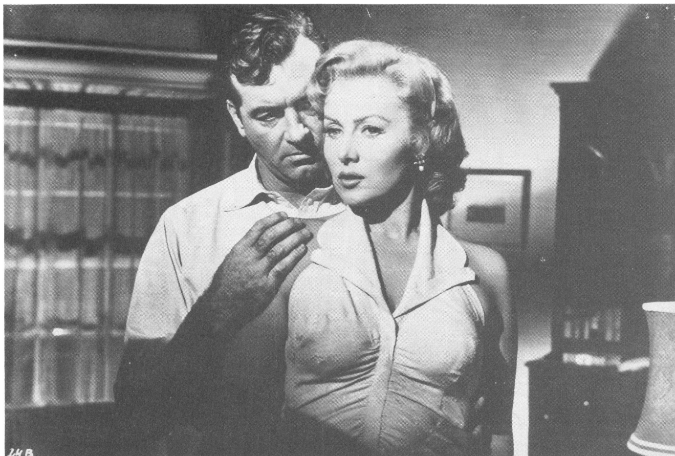
SLIGHTLY SCARLET (1956) John Payne, Rhonda Fleming - Gelassenheit und Selbstgewissheit

Allan Dwan, 1910 bis 1960: fünfzig Jahre Arbeit in Hollywood, fast ausnahmslos als Regisseur, Jahrzehnte hindurch einfach Film an Film gemacht, die beiden letzten Jahre immer wieder Projekte, die nicht zu realisieren waren. Ein grosses Leben - doch, zu unserem Glück, kein Lebenswerk, das ein Ganzes gibt am Ende, das auf einen Begriff zu bringen wäre. In Dwans Filmen spricht das Kino allein für sich selbst, aber sprechen ist nicht richtig, denn wenn das Kino bloss eine Sprache hätte, gäbe es nichts, was uns durch und durch bewegen würde, wenn wir einen Film erleben. Und alles wäre zu einfach.