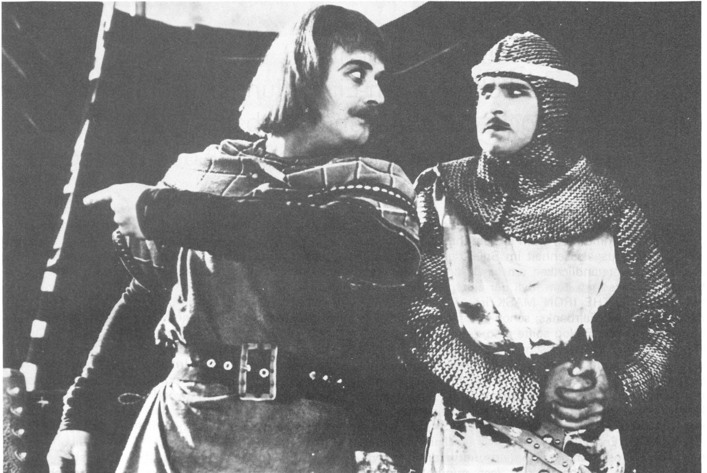
ROBIN HOOD (1922) - Ausgelassen die festgefügte Ordnung wieder in Bewegung bringen