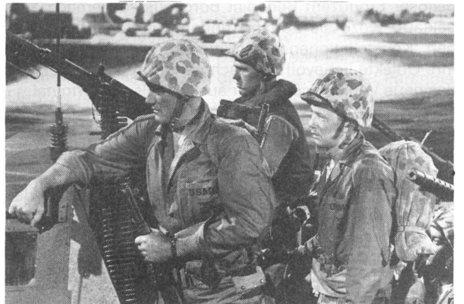
SANDS OF IWO JIMA