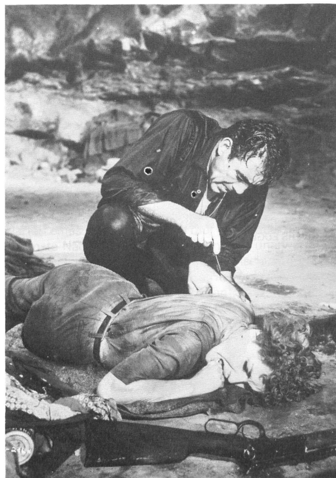
THE RIVER'S EDGE