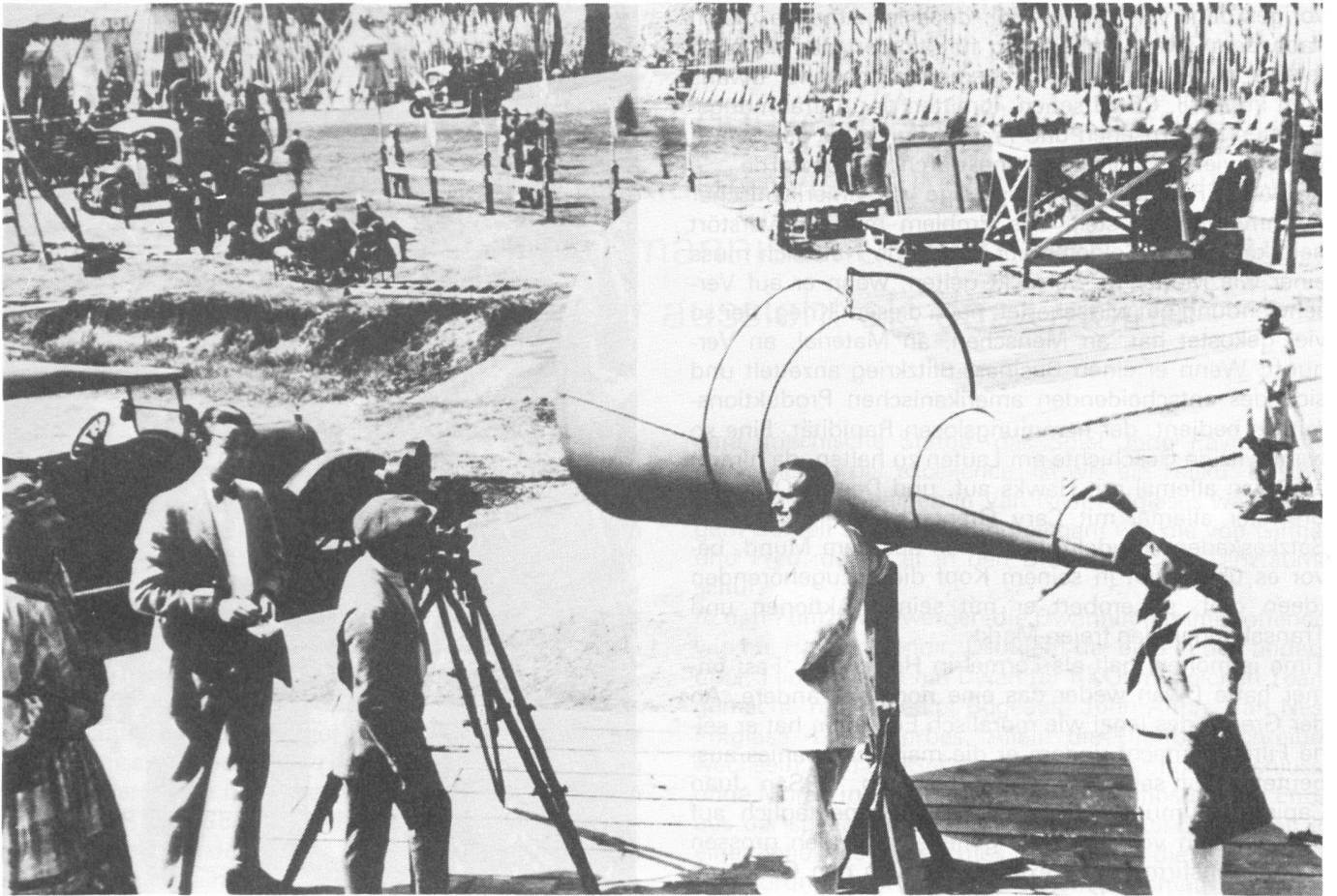
Set von ROBIN HOOD (1922), Douglas Fairbanks (im Zentrum)

V Die Geschichten bleiben ohne Abschluss, ohne Moral