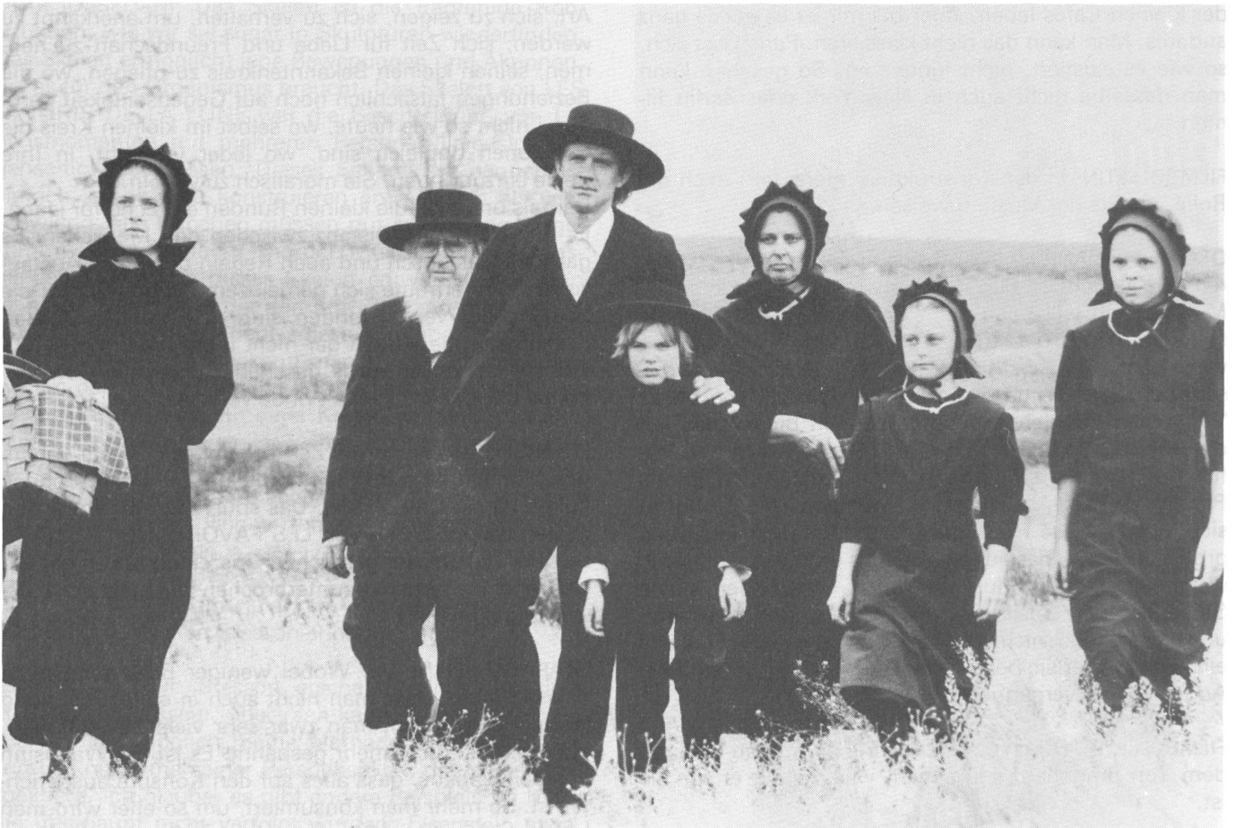
Wenn die Jahrzahl 1984 eingeblendet wird, glaubt man sich erst um ein Jahrhundert verlesen zu haben