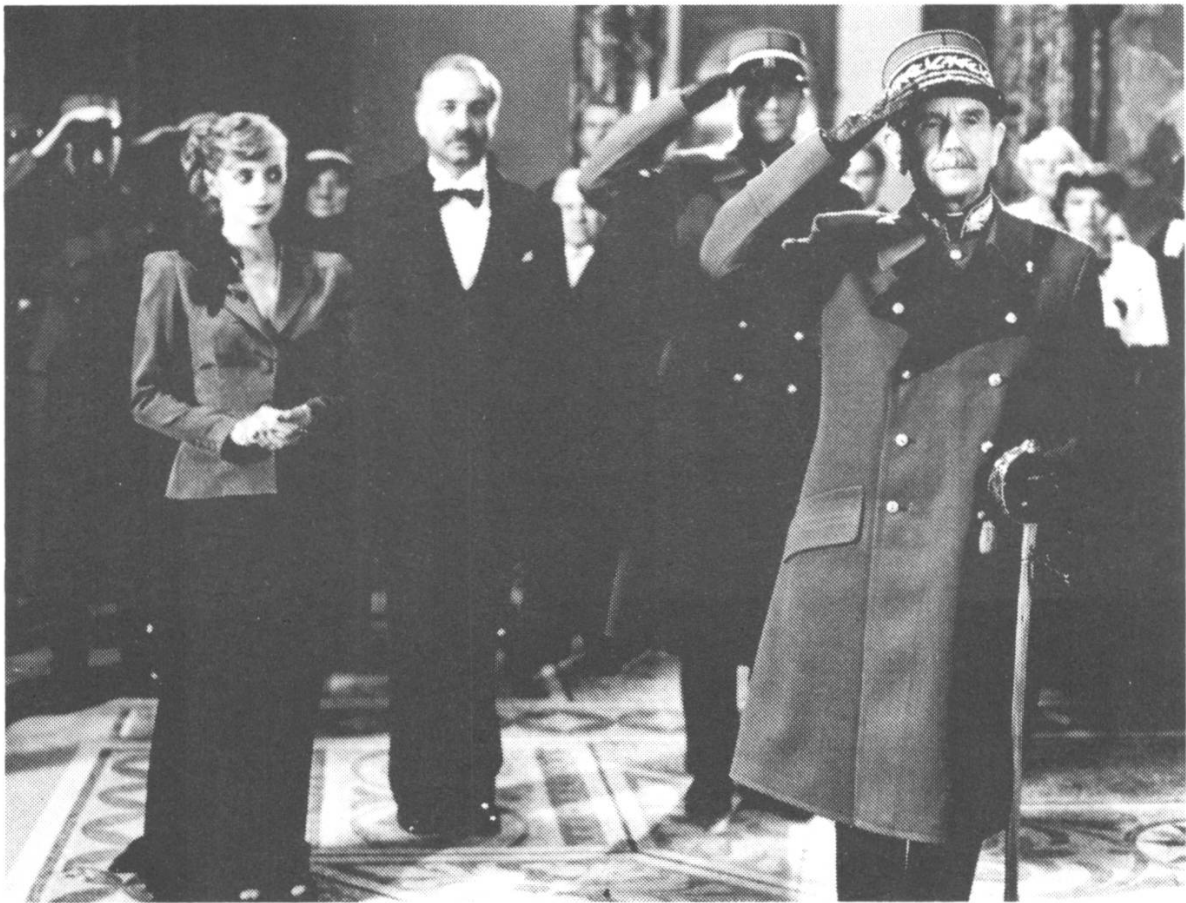
Szene 79 (Aussen / Dämmerung / Vorplatz): Der General steht grüssend ...

Donnerstag, den 13. Januar 1983: 9. Drehtag bei Thomas Koerfers neuem Spielfilm GLUT IM HERZEN (Arbeitstitel). Laut Tagesdisposition ist der allgemeine Arbeitsbeginn auf 13.30 Uhr angesetzt - Filmer müsste man sein, mag manch einer denken; immerhin ist Vorsicht geboten: "Drehschluss ca. 24 Uhr" -; Drehbeginn um 15 Uhr beim Schloss Castel in der Nähe von Tägerwilen ob Kreuzlingen am Bodensee. Gedreht werden die Szenen 79, 82 und 87 - oder eben: "die Ankunft des Generals".