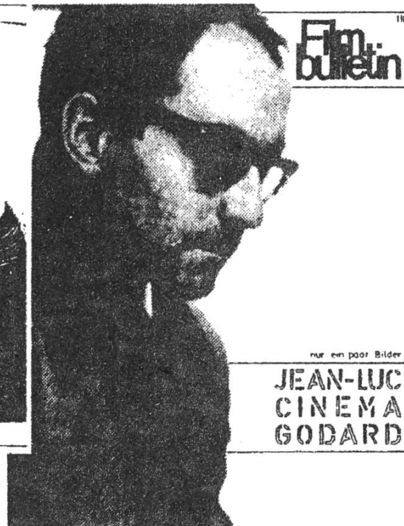
nur ein paar Bilder