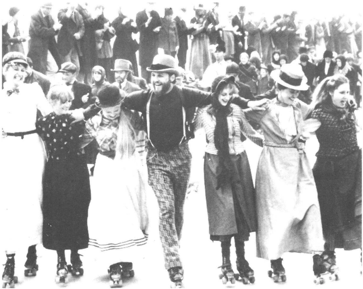
HEAVEN'S GATE: Liebe zum Detail und fantastische Masslosigkeit