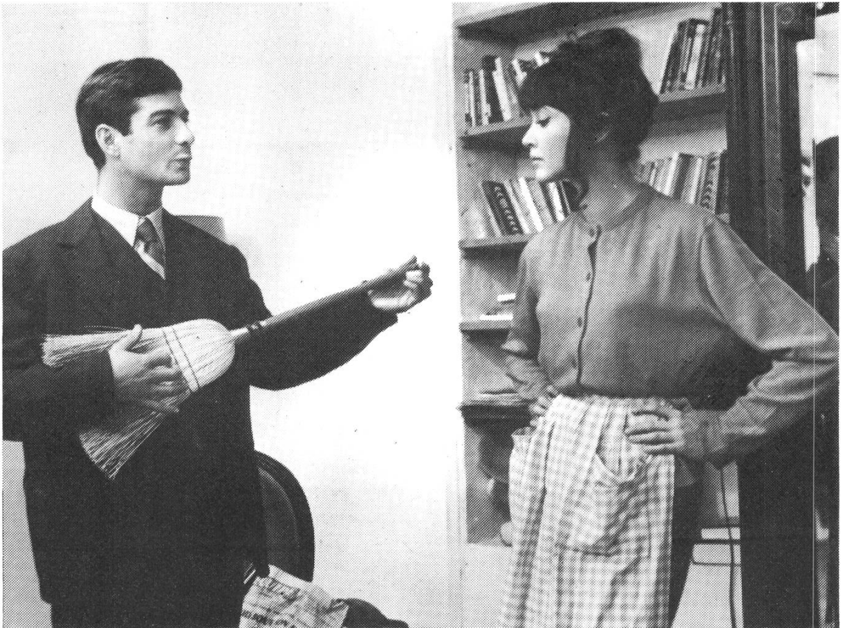
UNE FEMME EST UNE FEMME