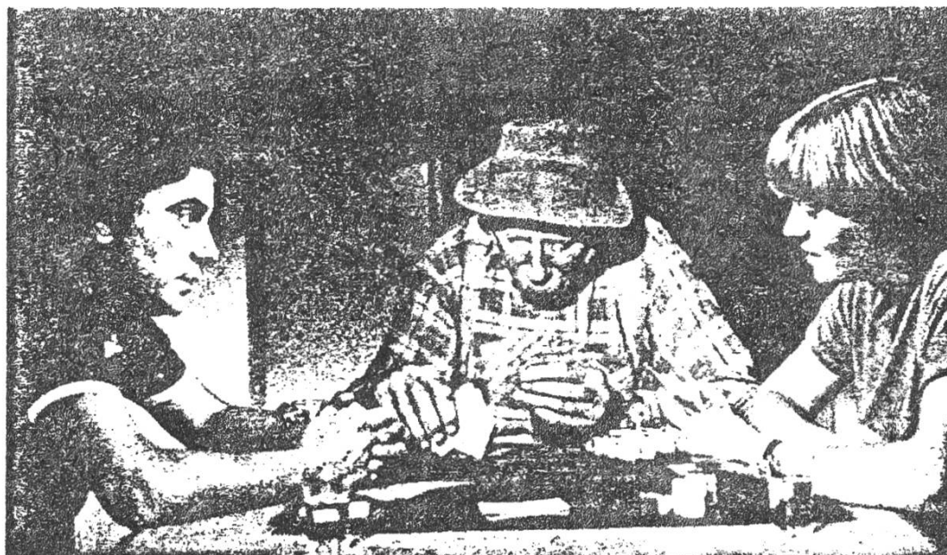
LES PETITES FUGUES