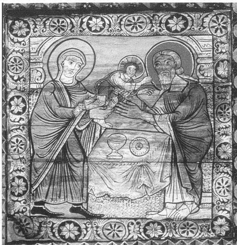
Fig. 1. Peintre Lombard, Présentation au Temple , vers 1120, Zillis, Saint-Martin.

La répartition des diocèses (Genève, Lausanne, Sion, Bâle, Constance, Coire, Côme et Milan) met en évidence la présence de deux niveaux différents qui interfèrent et se complètent dans la circulation des formes artistiques. Sur le substrat des aires culturelles se greffent des réseaux économiques et diplomatiques qui, favorisés en particulier par le clergé, garantissent entre l'époque carolingienne et la réforme grégorienne une relative unité, sans parvenir à masquer les variations imposées par les aires culturelles. La Suisse romande semble totalement dépendre de la région rhodanienne et de la Bourgogne, comme l'attestent par exemple le complexe de Romainmôtier ou la petite église de Saint-Pierre-de-Clages, liés à Cluny II. La Suisse alémanique semble regarder vers l'Empire ottonien à en juger par l'abbaye de Muri ou celle de Schaffhouse. La Suisse italienne et la plus grande partie des Grisons dépendent de la Lombardie, comme le suggère le plafond de Zillis qui présente un cas tout à fait significatif. Daté généralement très tard dans le XII e siècle, le plafond (fig. 1) révèle néanmoins un langage qui se retrouve notamment dans une