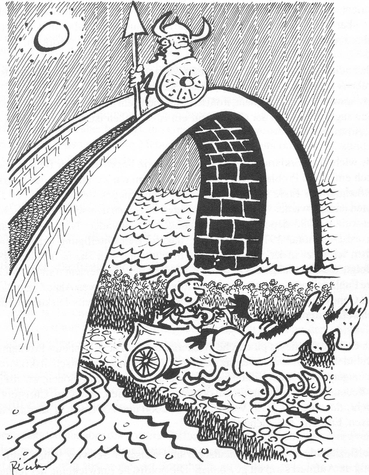
Zeichnung von Pécub