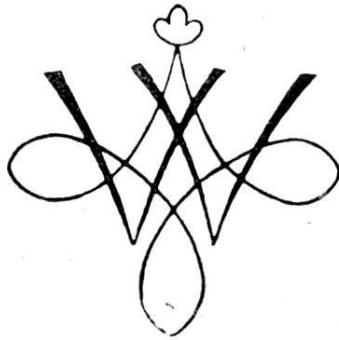
Familienmarke der Brandenburger zu Freiburg im Uechtland.

Der Vollständig- noch das Geschlecht ins Auge gefasst pen zeigt über ei- Baumstrunk, aus Flammen züngeln 4 . liesse sich an einen den Brandenburgern die Personalien der noch erreichbaren eine schlicht bürgerliche, ja bäuerliche Herkunft hinwiesen 5 .