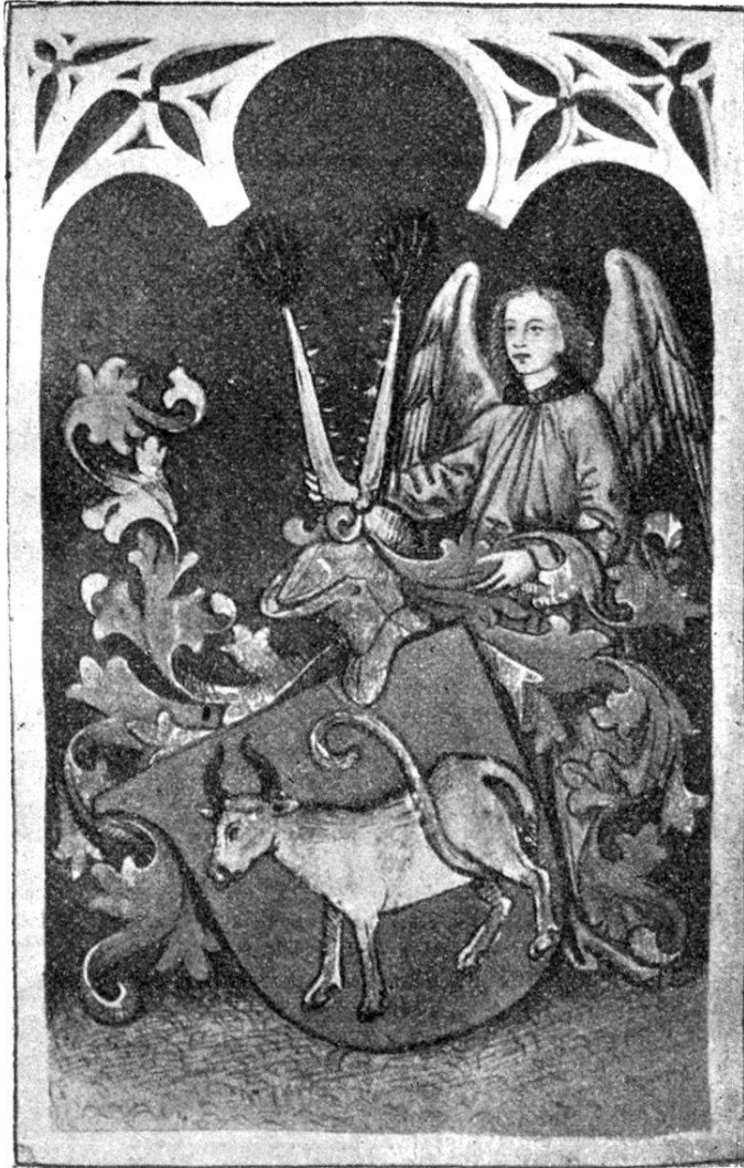
Das v. Brandenburgische Wappenbild.

merke bei den betreffenden Exlibris. Das wichtigere ist ein viel gebrauchtes Handbuch für Seelsorger, die erstmals 1477 zu Nürnberg, fast gleichzeitig auch in Venedig gedruckte Summa theologica des hl. Antoninus 1 ,