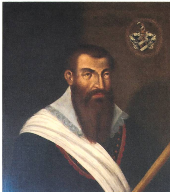
Abb. 1: Porträt des Johannes von Lanthen-Heid (Ausschnitt) im Gang des Kollegiumsgebäudes-West.

Die Präposition De- , bzw. Von- ist für die Bildung der deutschen und französischen Namen ganz unterschiedlich fruchtbar geworden: Im Anlaut De- beziehungsweise Du- oder Dou- gibt es von Dafflon über Dewarrat bis Doutaz und Duvillard nicht weniger als