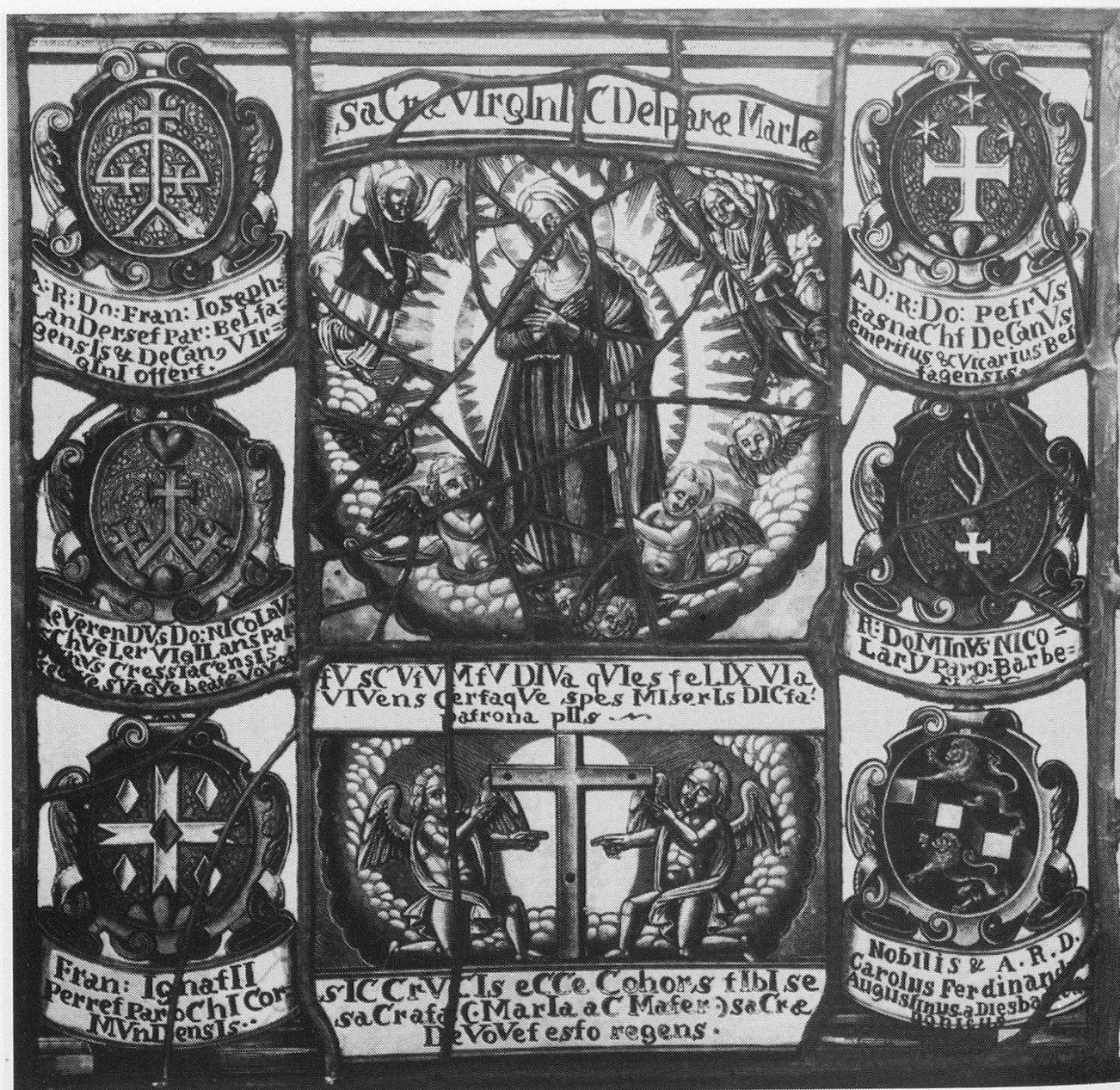
Abb. 5: Scheibe des Dekanats Heiligkreuz des Bistums Lausanne von 1710 für die Marienkapelle Dürrenberg, heute MKGF, Inv.-Nr. 3424.