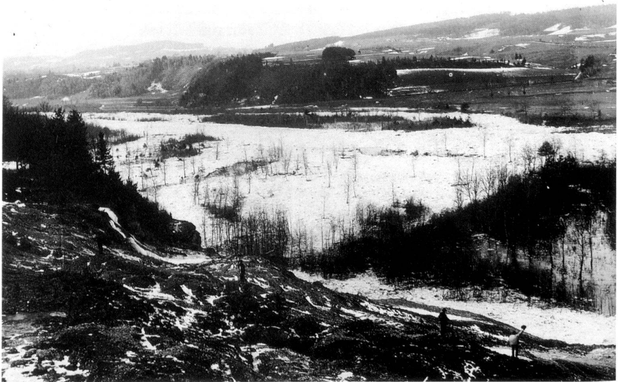
Abb. 4: Hochwasser der Sense mit Überschwemmung des Talbodens unterhalb Sensebrück um 1890.