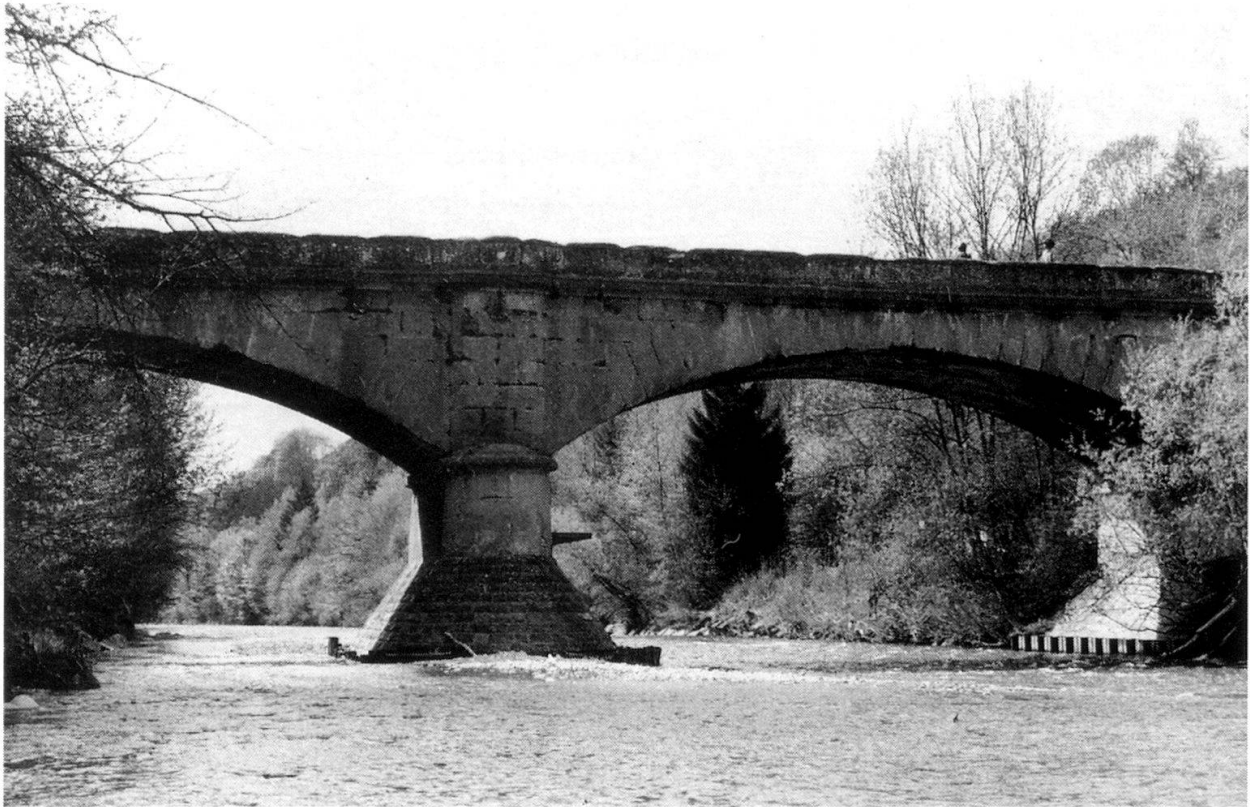
Abb. 3: Die dritte Steinbrücke von 1852–1854, zwischen Flamatt und Thörishaus, Zustand 1996.