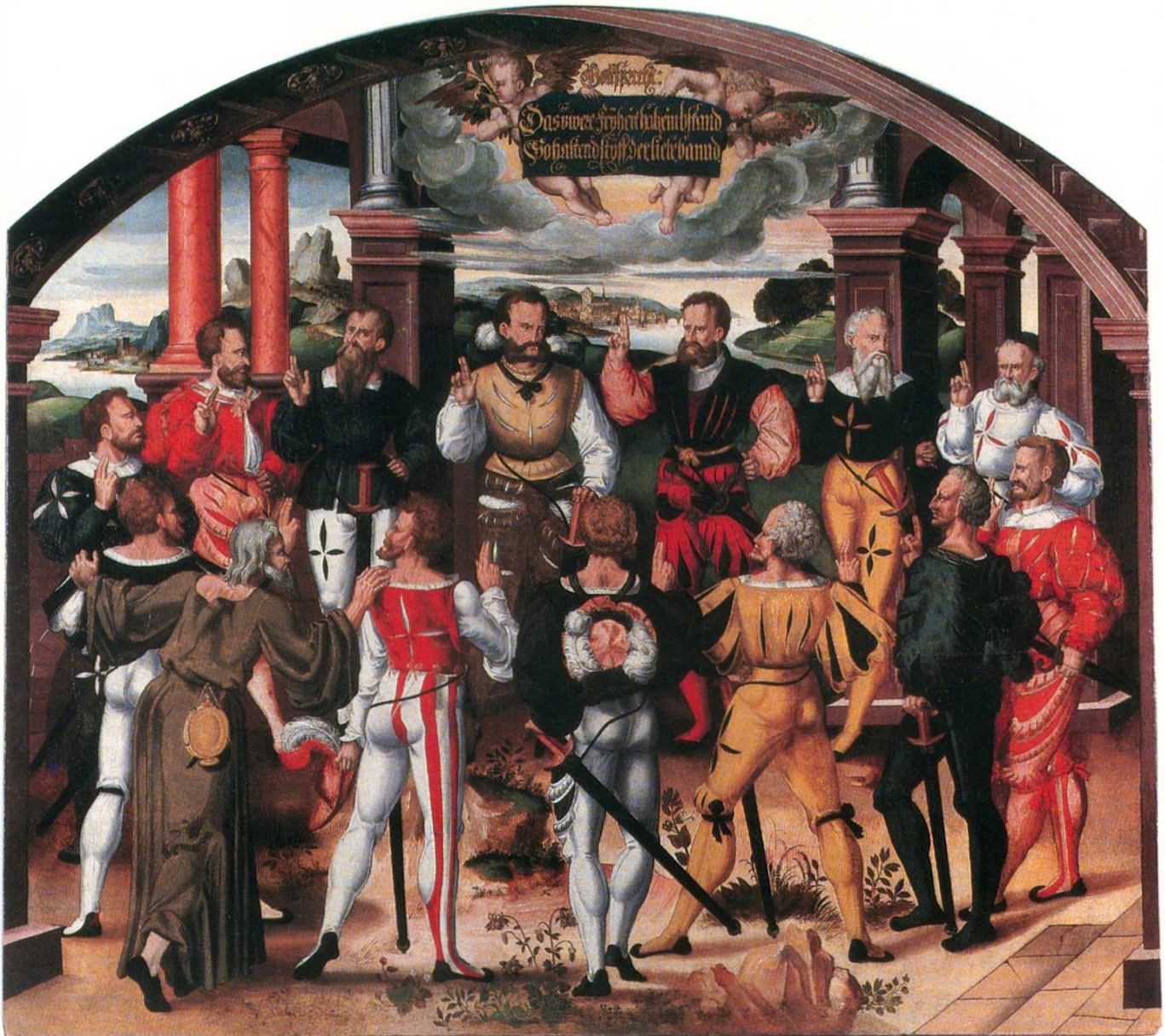
Abb. 2 – Humbert Mareschet, Gemälde für das Berner Rathaus, 1584–86, heute im Historischen Museum Bern.