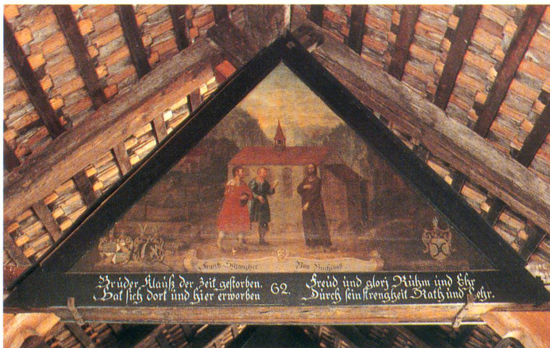
Abb. 1b – H.H. Wegmann, Gemälde im Giebel der Kapellbrücke in Luzern, um 1611.