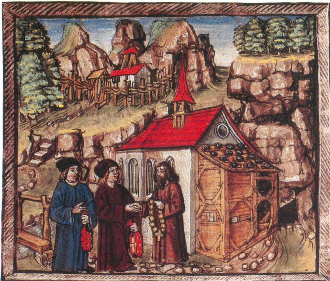
Abb. 1a – Diebold Schilling, Schweizer Bilderchronik, 1507/1513.