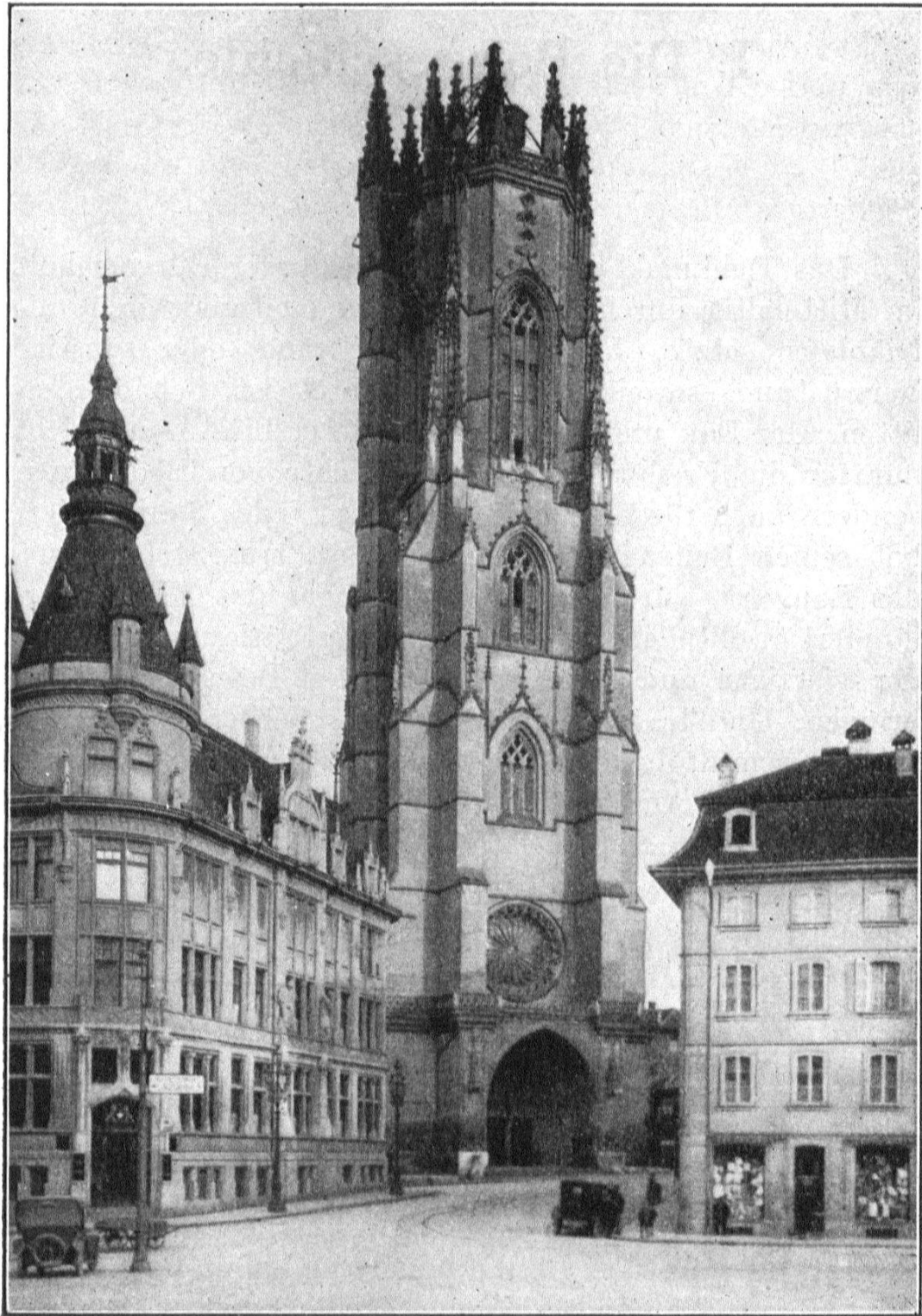
Abb. 1. Gesamtansicht der Kathedrale von Westen.