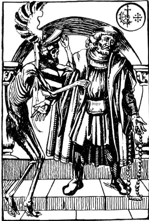
Nikolaus Manuel, del.