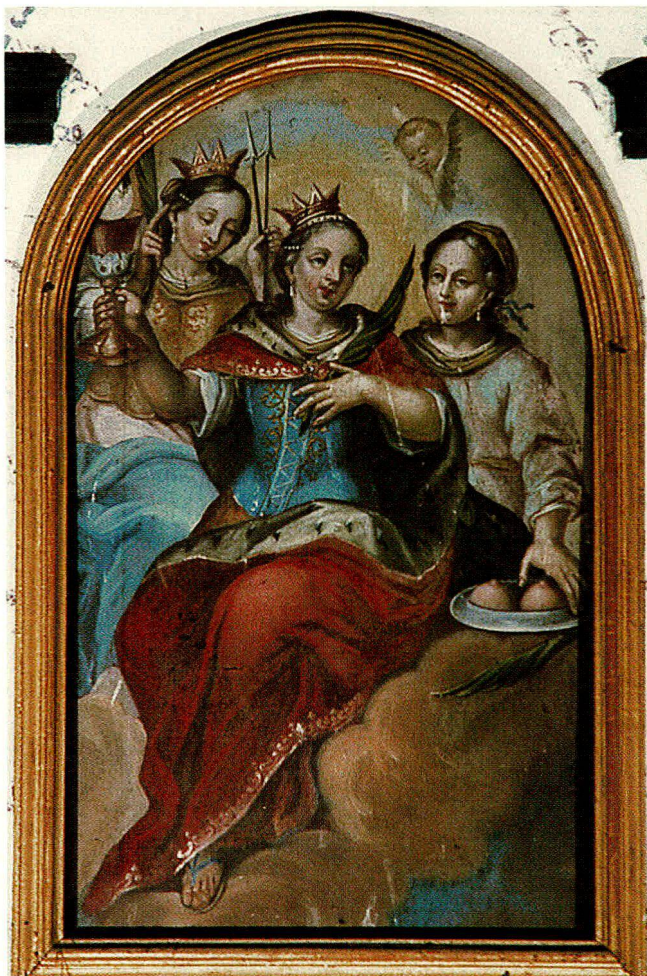
Bild 4: Oberbild des Antonius-Altars in der Klosterkirche Paradies, Kanton Thurgau. Die Heiligen Ursula, Barbara (in der Mitte) und Agatha; ca. 1728; Meister unbekannt.