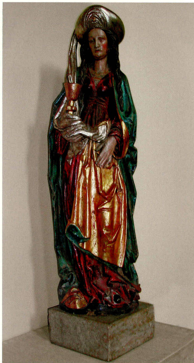
Bild 6: Statue der heiligen Barbara im Chor der Pfarrkirche St. Barbara in Rothenburg bei Luzern; Meister und Herkunft unbekannt; vermutlich süddeutsche Spätgotik.

Auch bei Artilleristen und Giessern sind die Barbarafeiern seit der Mitte des letzten Jahrhunderts wieder populärer, haben aber eher gesellschaftliche Bedeutung zur Pflege der Tradition und Verbundenheit. Bei Georg Fischer finden Barbarafeiern um den 4. Dezember in den Eisengiessereien in Deutschland und Österreich statt. Teilnehmer respektive Eingeladene sind Mitglieder der Giesserzunft, das heisst Ingenieure und Techniker des Giessereiwesens sowie sogenannte Hilfsgiesser, das heisst Nichtgiesser, die den