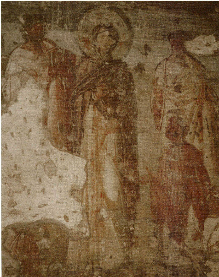
Bild 2: Fresko in der Kirche Santa Maria Antiqua in Rom, aus der Zeit um 705/706.

getrieben, dabei durch eine Wolke bedeckt, und schliesslich vom Vater enthauptet, nachdem sie Gott für einen guten Tod all jener gebeten hat, die sie anrufen. Der Vater wird vom Blitz erschlagen.