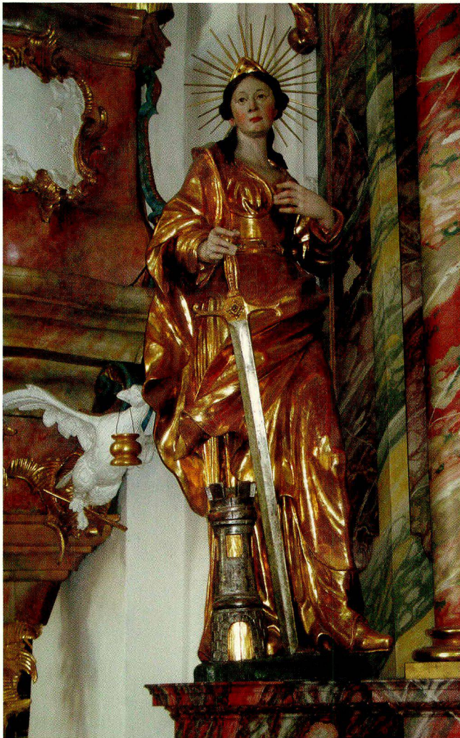
Bild 3: Statue der heiligen Barbara am Theodora-Altar in der Klosterkirche Rheinau, Kanton Zürich; Br. Stefan Engist, 1750.

Kreuzritter brachten die Legende nach Frankreich, Deutschland, Böhmen, Ungarn, Italien und rühmten sich dabei auch entsprechender Reliquien. Über Spanien und Portugal gelangte Barbara später in die neue Welt nach Nord- und Südamerika.