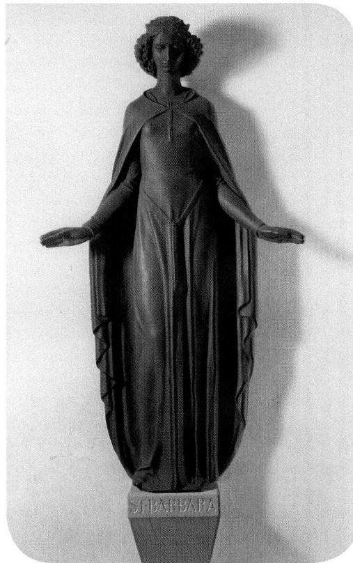
Bild 1: St. Barbara im Eingang zur Eisenbibliothek; nach Heinrich Moshage; Grauguss, schwarz.

Geboren 1937 in Meggen bei Luzern. Studium an der Eidg. Techn. Hochschule in Zürich mit Abschluss als Dipl. Masch. Ing. ETH. Dort als Vorlesungs-Assistent und anschliessend in der Schweiz und in den USA als Betriebs- und Konstruktionsingenieur tätig. 1967–2001 bei der Georg Fischer AG vorerst im Giesserei- und Giessereianlagenbereich aktiv, dann in der Unternehmensgruppe Piping Systems und schliesslich bis zur Pensionierung als Mitglied der Konzernleitung Leiter der Unternehmensgruppe Anlagenbau. Artillerieoffizier a. D. der Schweizer Armee. 16 Jahre Mitglied des Vorstandes der Stiftung Eisenbibliothek, davon 13 Jahre als deren Präsident.