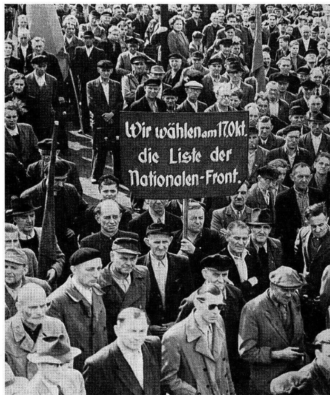
Kundgebung der Belegschaft des VEB Leuna-Werke «Walter Ulbricht» zur Verleihung der Ministerratsfahne am 20. September 1954. Am 17. Oktober 1954 fanden in der DDR Wahlen zur Volkskammer statt.

kraten zu. Wenn sie als Betriebsräte oder Gewerkschaftsfunktionäre vor 1933 und zwischen 1945 und 1948 nicht der radikalen Position der KPD bzw. der SED gefolgt waren, wurde ihre Existenz entweder verschwiegen, oder sie wurden politisch diffamiert. Der dritte Mangel zeigt sich darin, dass in den Geschichten der Staatsbetriebe der Eindruck erweckt wurde, die SED-Betriebsparteiorganisationen, insbesondere aber ihre Leitungen, haben eigentlich die Betriebe geführt. Damit sollte der Nachweis erbracht werden, dass die SED-Parteiorganisationen die führende Rolle in den Betrieben ausübten. Bei genauem Hinsehen zeigt sich, dass es nicht der Parteileitungen bedurfte, um in den Betrieben die richtigen Entscheidungen zu treffen, denn die Fachleute wussten selbst, was zu tun war. Die Parteileitungen mussten sich ohnehin auf deren Auskünfte stützen, wenn sie einen fachlich ausgerichteten Beschluss fassen wollten. Vielmehr war es oft umgekehrt. Die Betriebsfunktionäre, die Wissenschaftler und Ingenieure nutzten Parteitags- und ZK-Beschlüsse, um ein angestautes Problem rascher zu lösen. Ein treffendes Beispiel für diese Art von Betriebsgeschichtsschreibung ist die «Geschichte des VEB Leuna-Werke «Walter Ulbricht» 1945–1981», die 1986 erschienen ist. 24