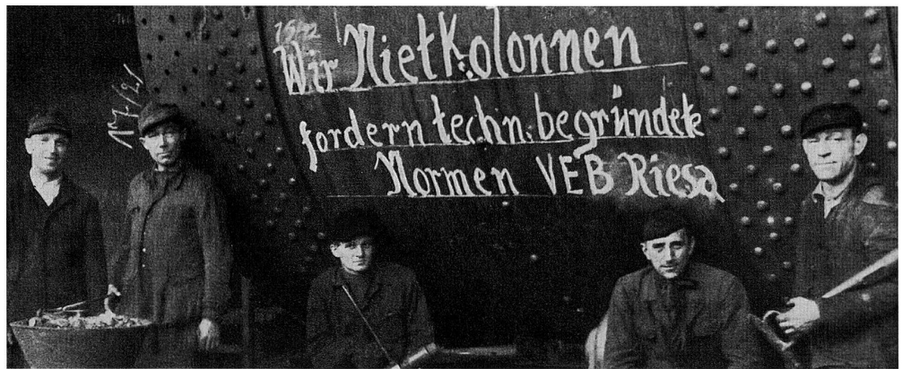
Aktivisten des Jahres 1948 im Stahlbau, Stahl- und Walzwerk Riesa.

an der Niederschrift der Endfassung zu beteiligen. Dadurch wurde nicht nur das Interesse an dem Vorhaben in der Belegschaft geweckt, sondern auch vieles, das sich in keinem Archiv fand, zutage gefördert. Da aber in zunehmendem Masse die Betriebsparteiorganisationen der SED die Konzeptionen vorgaben, kam es bei der Niederschrift der einzelnen Passagen und des Gesamtmanuskriptes immer wieder zu Auseinandersetzungen über die Bewertung betrieblicher Vorgänge, die zumeist zu inhaltlichen Verlusten führten, denn die Betriebsgeschichten konnten nur dann erscheinen, wenn der gesamte Text von den Parteiinstanzen gebilligt worden war.