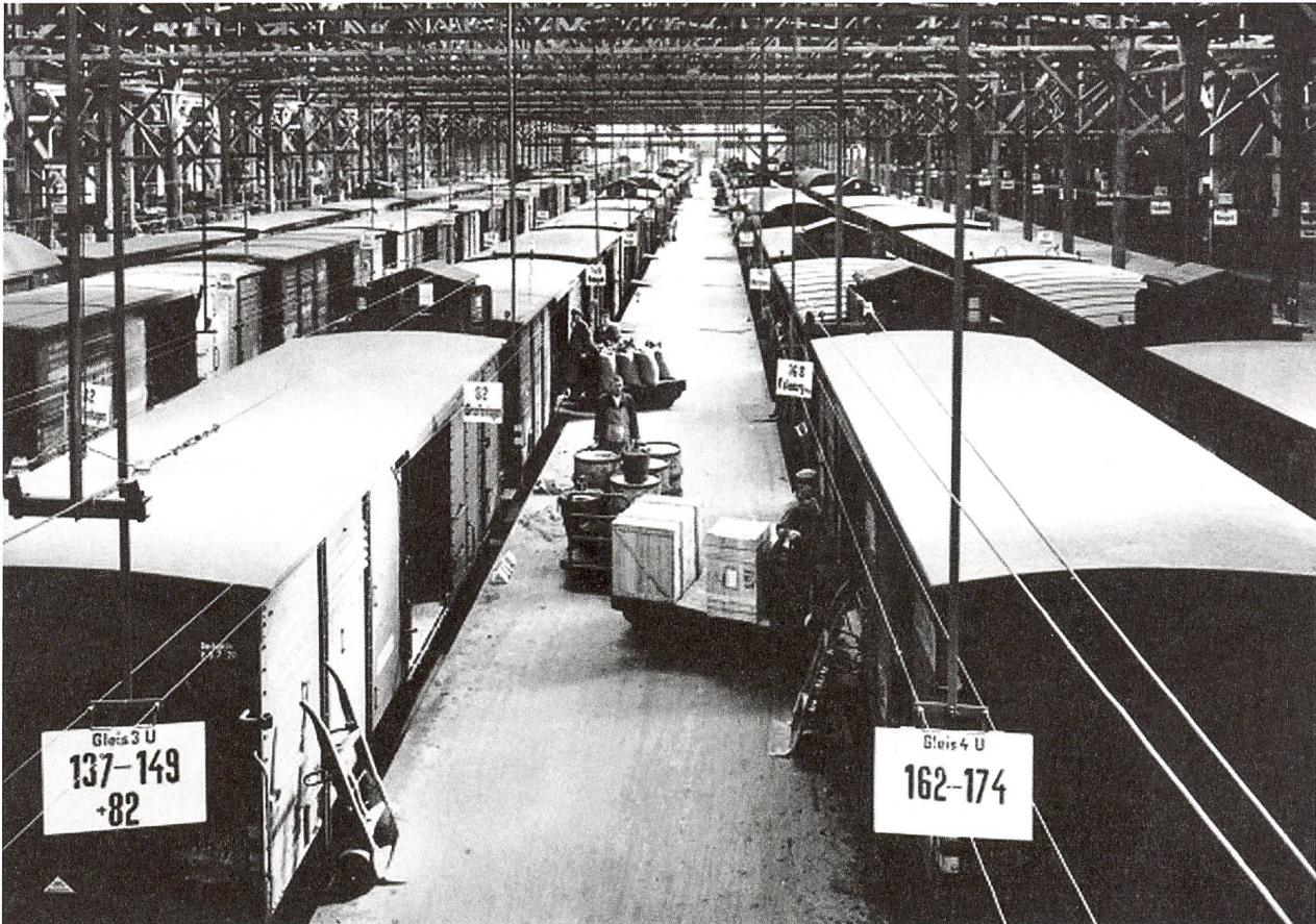
2 Stückgut-Umladehalle in Stettin, 1932.