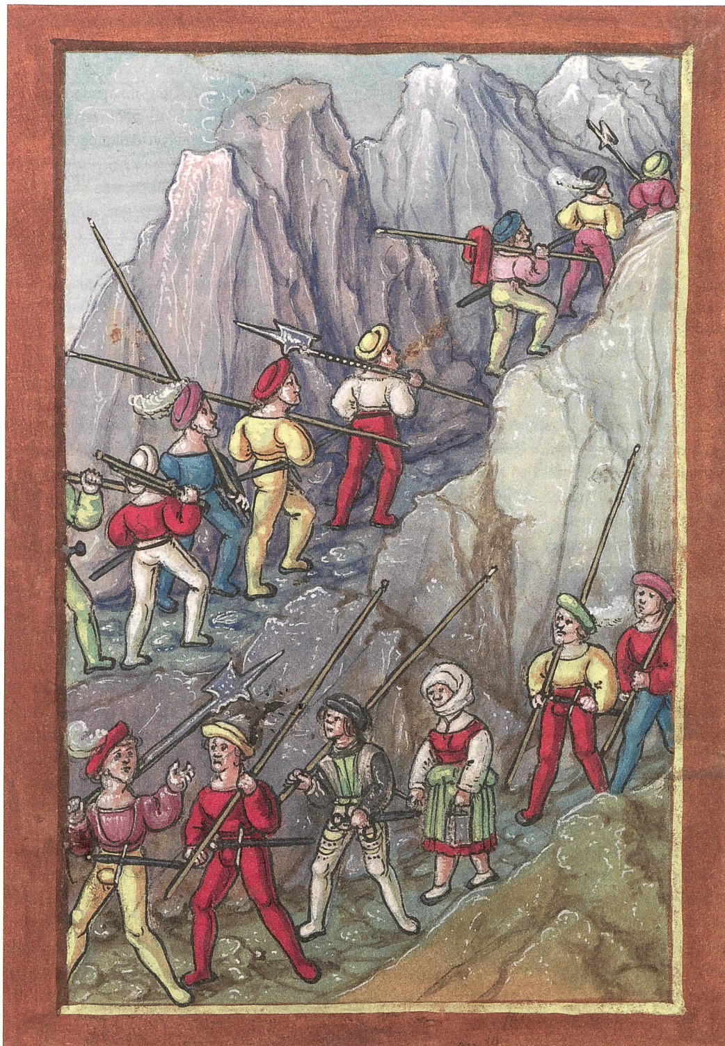
1 Nach der Eroberung von Cremona verlassen eidgenössische Söldner heimlich das französische Heer und ziehen über das Gebirge nach Hause. Aus der Eidgenössischen Chronik des Luzerners Diebold Schilling (Luzerner Schilling), 1513.

logistische Unterlegenheit der Eidgenossen und taktisch-materielle französische Überlegenheit.