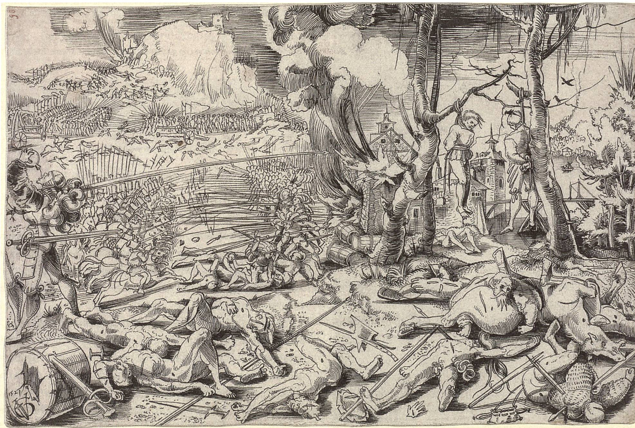
4 Schrecken des Kriegs: Das Schlachtfeld von Marignano. Federzeichnung von Urs Graf, 1521.

Es gilt also festzuhalten, dass man nicht nur von der Artillerie im Sinne von Kanonen sprechen darf, sondern alle Fernwaffen, Handfeuerwaffen und Armbrüste mit einbeziehen muss. Im Zusammenspiel mit Kavallerie und der Infanterie kommt dann die technische Überlegenheit in der Defensive erst zustande.