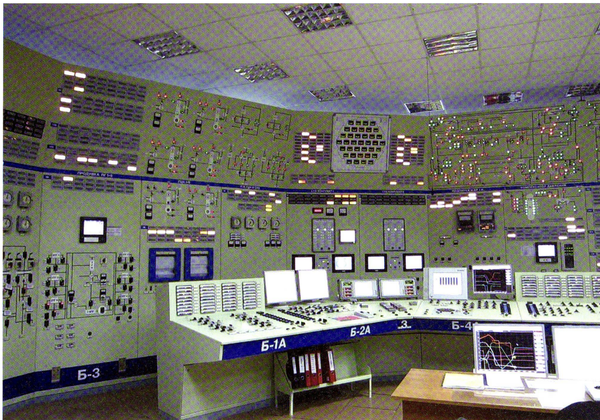
Wissensordnung an der Mensch-Maschine-Schnittstelle, 2013: KKW Rivne, Simulator Schaltwarte Block 2, VVER-440, Reaktorfahrpult und dazugehörige Anzeigetafeln. Die Ausrüstung des Simulators ist identisch mit jener der Original-Schaltwarte. Gut erkennbar sind oben links und rechts die aus der analogen Zeit beibehaltenen Flie遥bilder des Primärkreislaufs und seiner Hilfssysteme. Im zentralen Bereich haben die digitalen Ausgabemedien des Reaktorschutzsystems die analoge Instrumentierung abgelöst. Die Kernquerschnittstafel im Zentrum oben zeigt auf einen Blick die sektoralen Positionen der (in den Anzeigefenstern farbig unterschiedlich umrahmten) Steuerstabgruppen, die hier sämtlich bis auf die unterste Position eingefahren sind: Der «Reaktor» wurde im Zuge einer Störfallsimulation schnellabgeschaltet. Dieses sogenannte mnemotablo wurde erst im Zuge einer Modernisierung eingerichtet: In der Originalausstattung der Warte von 1980 gaben analoge Anzeigen der Drehmeldesysteme (russ. sel'siny, von engl. selsyns) Auskunft über die Position der Steuerelemente.