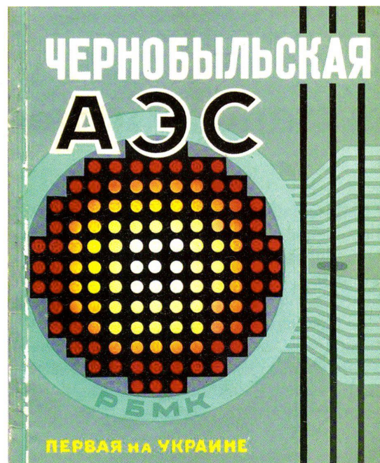
Kerntechnisches Wissen popularisieren: Broschüre über das KKW Tschernobyl aus der Zeit des Kernenergie-Booms in der Sowjetunion. Hier wird das Bauprinzip des Druckröhren-Siedewasserreaktors RBMK zur Grundlage einer grafischen Ästhetisierung. (Quelle: Černobyl'skaja AĖS s reaktorom RBMK-1000. Pervaja na Ukraine, Kiev 1977, Titelblatt)

Die Kerntechnik und insbesondere die Kernkraftwerkstechnik ist historisch eine verhältnismässig junge Technologie, die in den Industriegesellschaften des globalen Nordens ab Mitte der 1960er-Jahre, im grossindustriellen Massstab aber erst seit Mitte der 1970er-Jahre eingesetzt wurde. Folglich können wir relativ zeitnah beobachten, wie Wissen mit den Wissensträgern aus alten in neue Industrien wandert. Genaugenommen beginnt die Geschichte des kerntechnischen Wissens natürlich in den Laboren von Marie Curie, Otto Hahn oder Lise Meitner, lange vor der grossindustriellen Geschichte der Kerntechnik. Jedoch trat die Kernforschung im Zweiten Weltkrieg rasch aus der theoretisch-experimentellen in die praktisch-industrielle Phase über. Für Isotopentrennung, Urananreicherung und Kernspaltung zwecks Plutoniumherstellung war man in immer grösserem Masse auf das Know-how von Technikern, Ingenieuren und Logistikern angewiesen. Viele dieser Spezialisten, die noch klassische Ausbildungsgänge durchlaufen hatten (Physik, Chemie, Metallurgie), wechselten später in die zivile Atomindustrie. Seit den 1950er-Jahren schufen etablierte Institutionen neue Fachbereiche für die Ausbildung des kerntechnischen Nachwuchses: In Frankreich fand