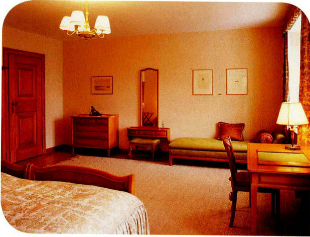
Vor dem Umbau.