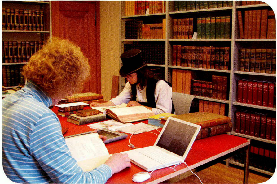
Die Eisenbibliothek nach dem Umbau.

Dr. phil, Studium der Geschichte und Germanistik in Gießen und Tübingen. Promotion zu einem landes- und universitäts-geschichtlichen Thema. 1979 bis 1993 Wissenschaftliche Mitarbeiterin an der Universität Tübingen und anschliessend im Wirtschaftsarchiv Baden-Württemberg in Schloss Hohenheim. 1994 bis 2001 Leiterin des Kultur- und Archivamtes des Landkreises Ravensburg. Seit 2002 Geschäftsführerin der Stiftung Eisenbibliothek. Publikationen zur Landes-, Regional- und Wissenschaftsgeschichte.