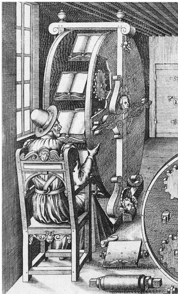
Bücherleserad von Agostino Ramelli, 1588.

Besuchen Sie die Eisenbibliothek im Internet ( www.eisenbibliothek.ch ) oder kommen Sie persönlich vorbei – ob als Bibliotheksbenutzer oder im Rahmen einer Führung durch die historischen Räume der Sammlung. Das Team der Eisenbibliothek freut sich auf Sie!