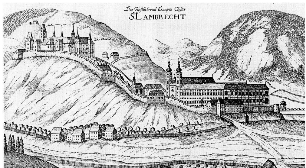
Benediktinerabtei St. Lambrecht (1681)