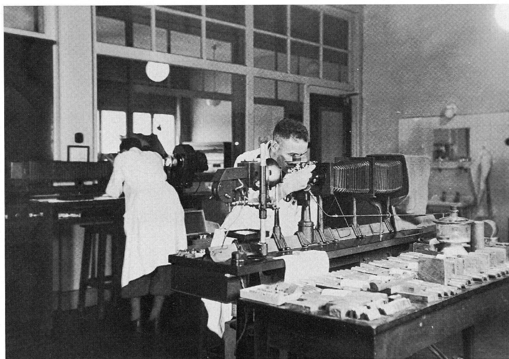
Kamera für metallographische Aufnahmen in einem Labor der Vereinigte Stahlwerke AG 1930er Jahre

Die Ruhrwerke stellten in den eigenen Versuchsanstalten und im Kaiser-Wilhelm-Institut für Eisenforschung in Düsseldorf Untersuchungen an, um zu beweisen, dass die veröffentlichten Festigkeitswerte überhöht waren und weit streuten. Es kam zu einem Gutachterstreit, wobei die Freund AG und die Mit-