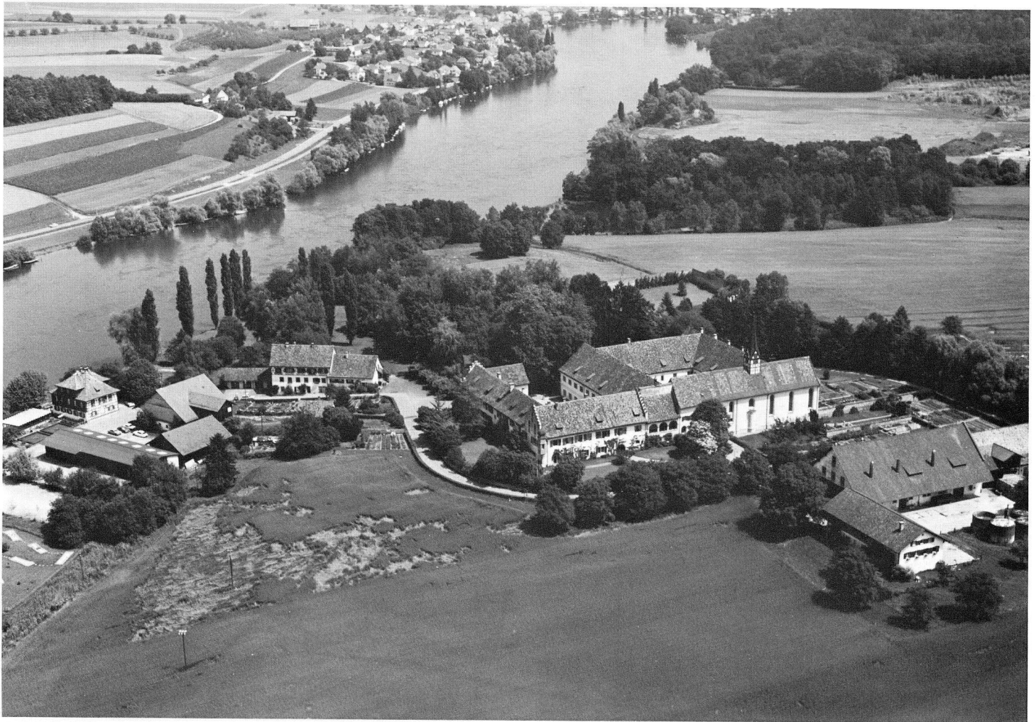
Das Klostergut Paradies, Sitz der Stiftung Eisen-Bibliothek.