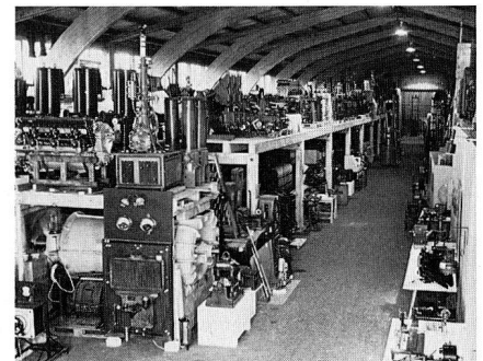
Über 7000 Objekte warten darauf, im Technorama ausgestellt und der Öffentlichkeit zugänglich gemacht zu werden.