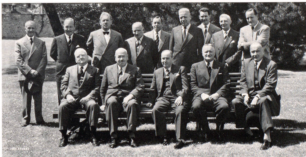
Stiftungsrat und Mitarbeiter

Am 14. Mai dieses Jahres trafen sich im Paradies die Mitglieder des Stiftungsrates, aus den Vereinigten Staaten, England, Frankreich, Deutschland, Italien und der Schweiz, zu einer Arbeitstagung mit den Schaffhauser Organen der Eisenbibliothek. Es war dies eine willkommene Gelegenheit, an Ort und Stelle einen allen erwünschten Einblick zu vermitteln in die Organisation und die bisherige Tätigkeit der Bibliothek, die nun rund 18 000 Bände in 15 Sprachen umfasst. Der Bücherbestand konnte in der kurzen Zeit seit der Gründung mengenmässig und qualitativ, gegen alle düsteren Prophezeiungen, auf ein beachtenswertes Niveau gebracht werden. Den begeisterten Helfern seien hier Dank und Anerkennung ausgesprochen.