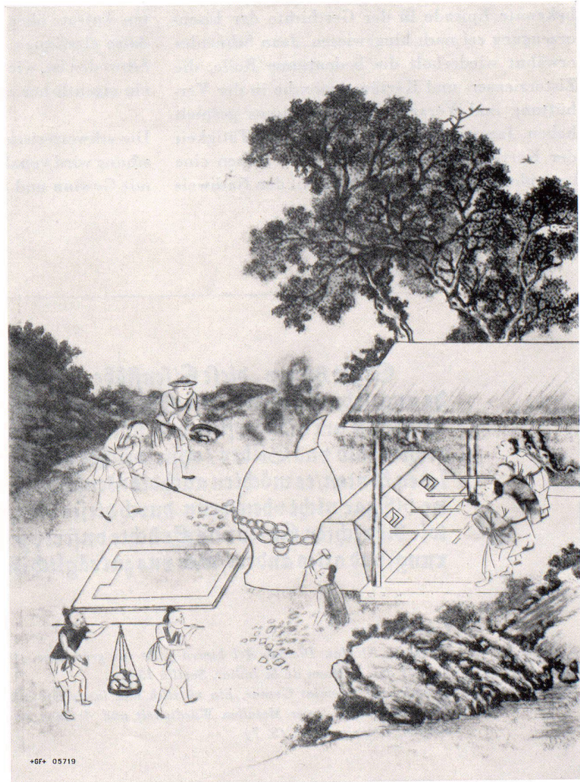
Älteste bekannte Abbildung eines chinesischen Hochofens aus dem Werk Ao Phu Thu Yung, 1334.

Im 17. Jahrhundert verursachte der Mangel an Holzkohle eine Krise der Eisenproduktion, die