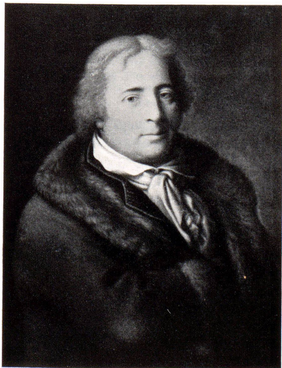
Gottlieb Emanuel Gruber 1759—1829

Im Jahre 1784 hatte Gruber schon als junger Fürsprech die besondere Auszeichnung, als «Procurator coram CC», d. h. vor dem «Rathe der 200»,