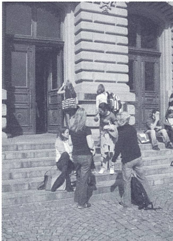
Frauen auf dem Weg zu Vorlesung oder Seminar. Eingang des Hauptgebäudes der Universität Bern.

de devenir professeure (environ dix ans plus tard) pourrait être la même que celle d'un homme. Cela pourrait donc signifier 50%