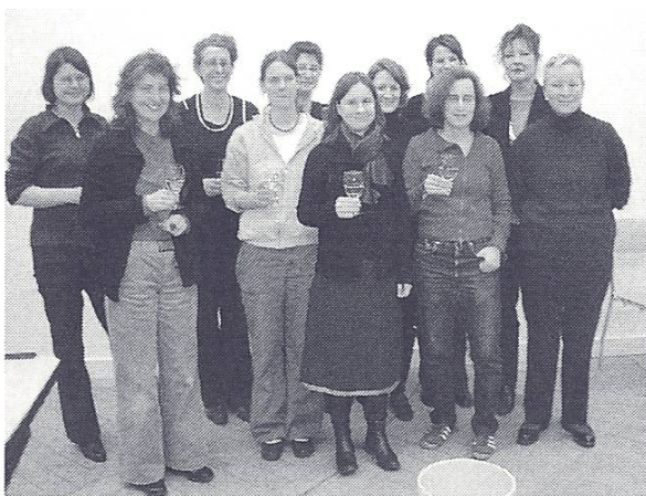
Vertreterinnen der Frauenstadtrundgänge Basel, Zug und Zürich